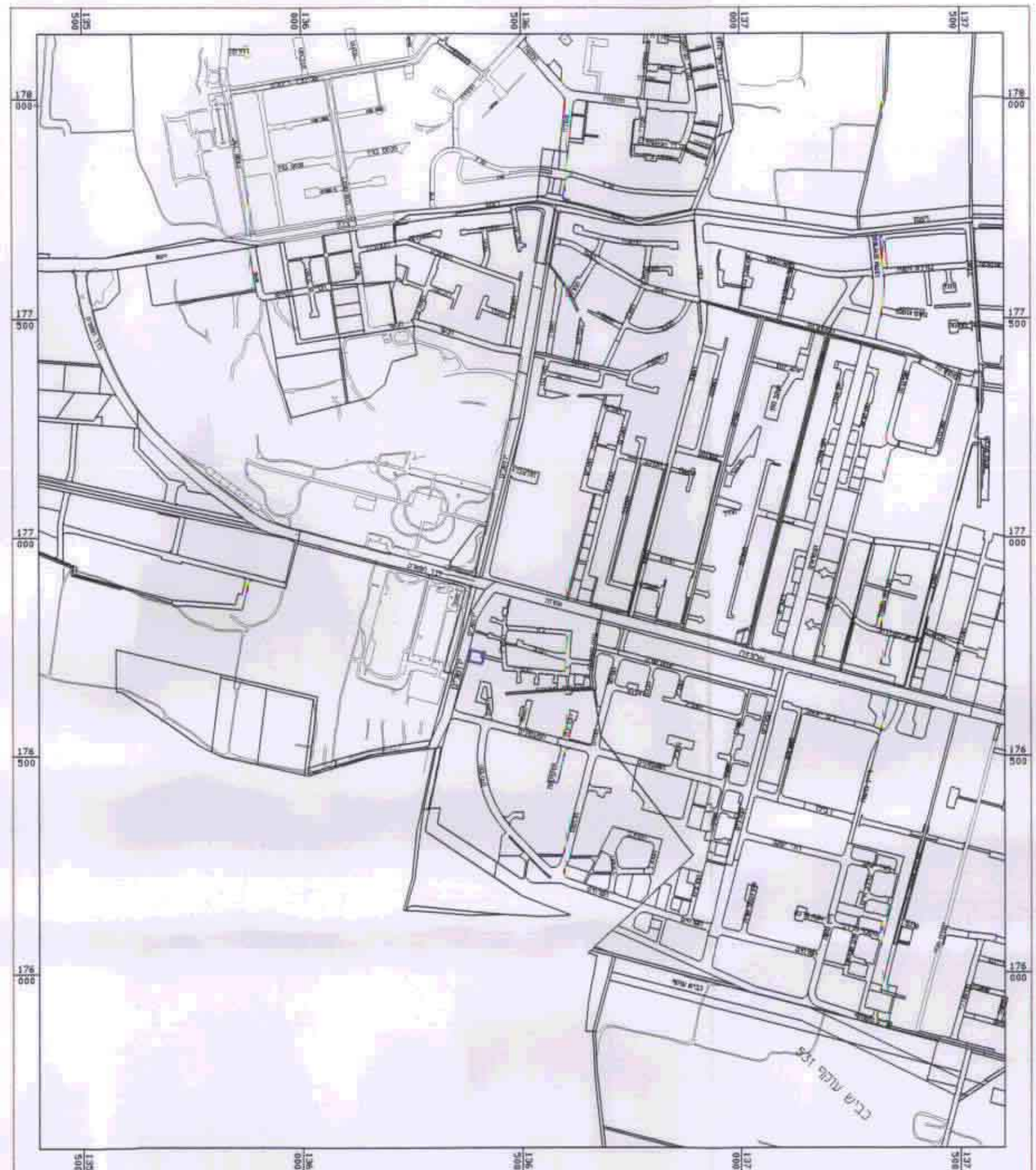
תרשים התמצאות קנ"מ 1:10,000

מחוז: המרכז נפה: פתח-תקוה עיר: רעננה גוש: 7651 חלקה: 334 שטח התכנית: 735 מ"ר יוזם התכנית: הועדה המקומית לתכנון ובניה רעננה עורך התכנית: מחלקת הנדסה, עיריית רעננה בעלי הקרקע: אהובה ברוידא קנ"מ: 1:10,000 , 1:500 , 1:5000