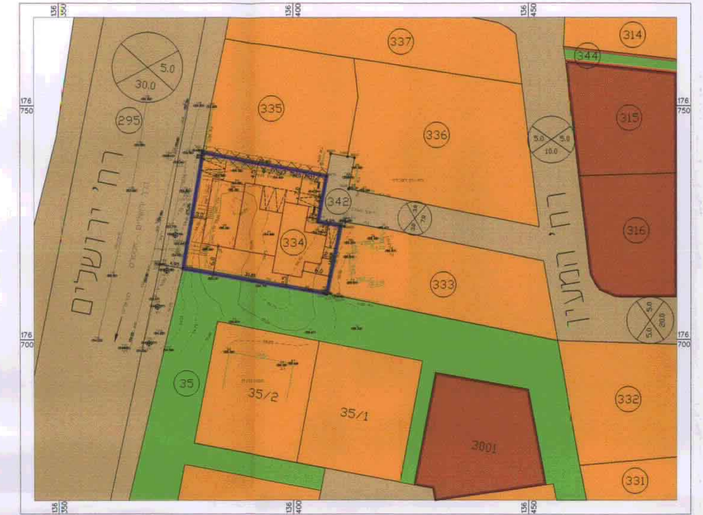
מצב מוצע קנ"מ 1:500