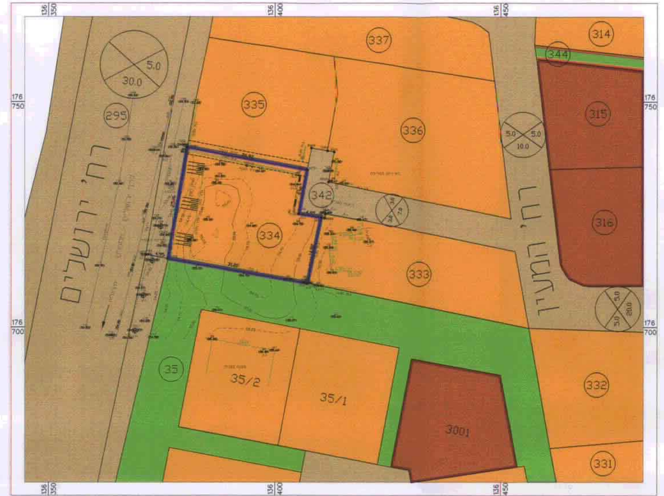
מצב קיים קנ"מ 1:500