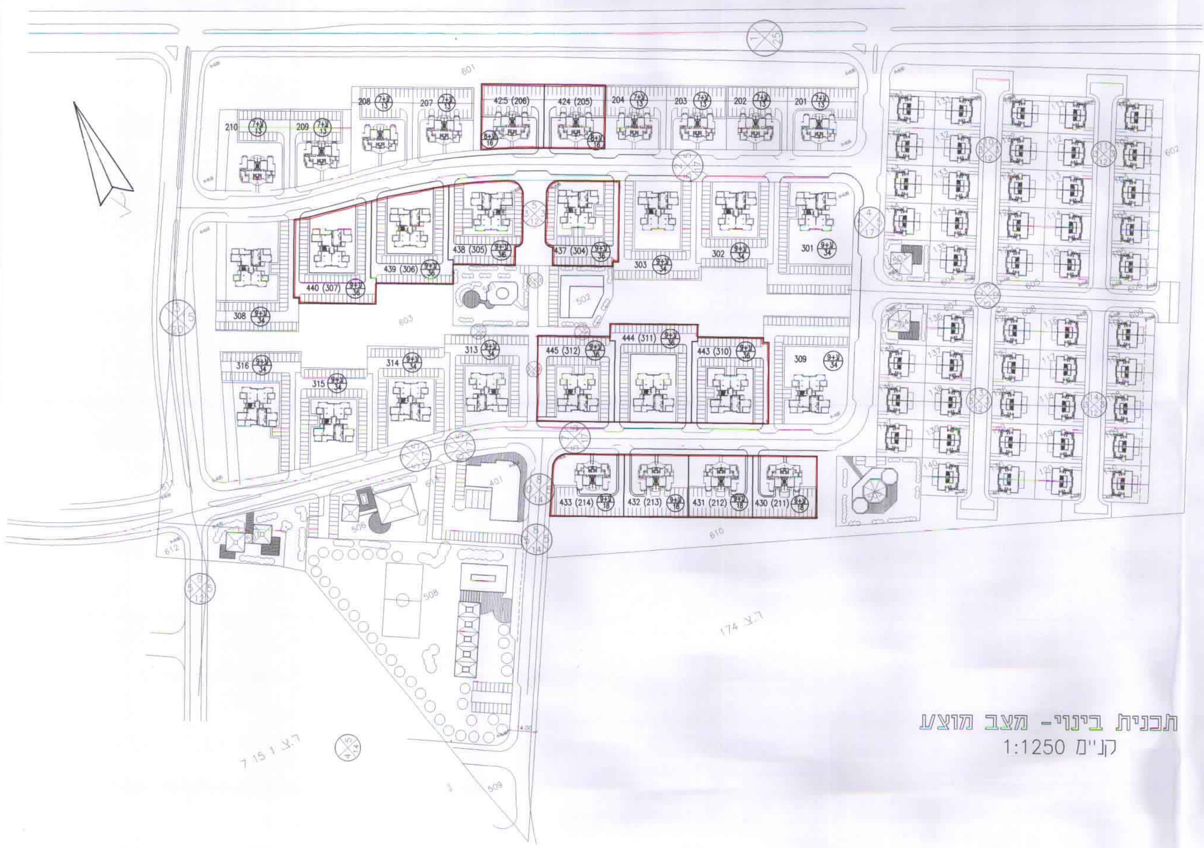
תכנית בינוי - מצב מוצע קני"מ 1:1250