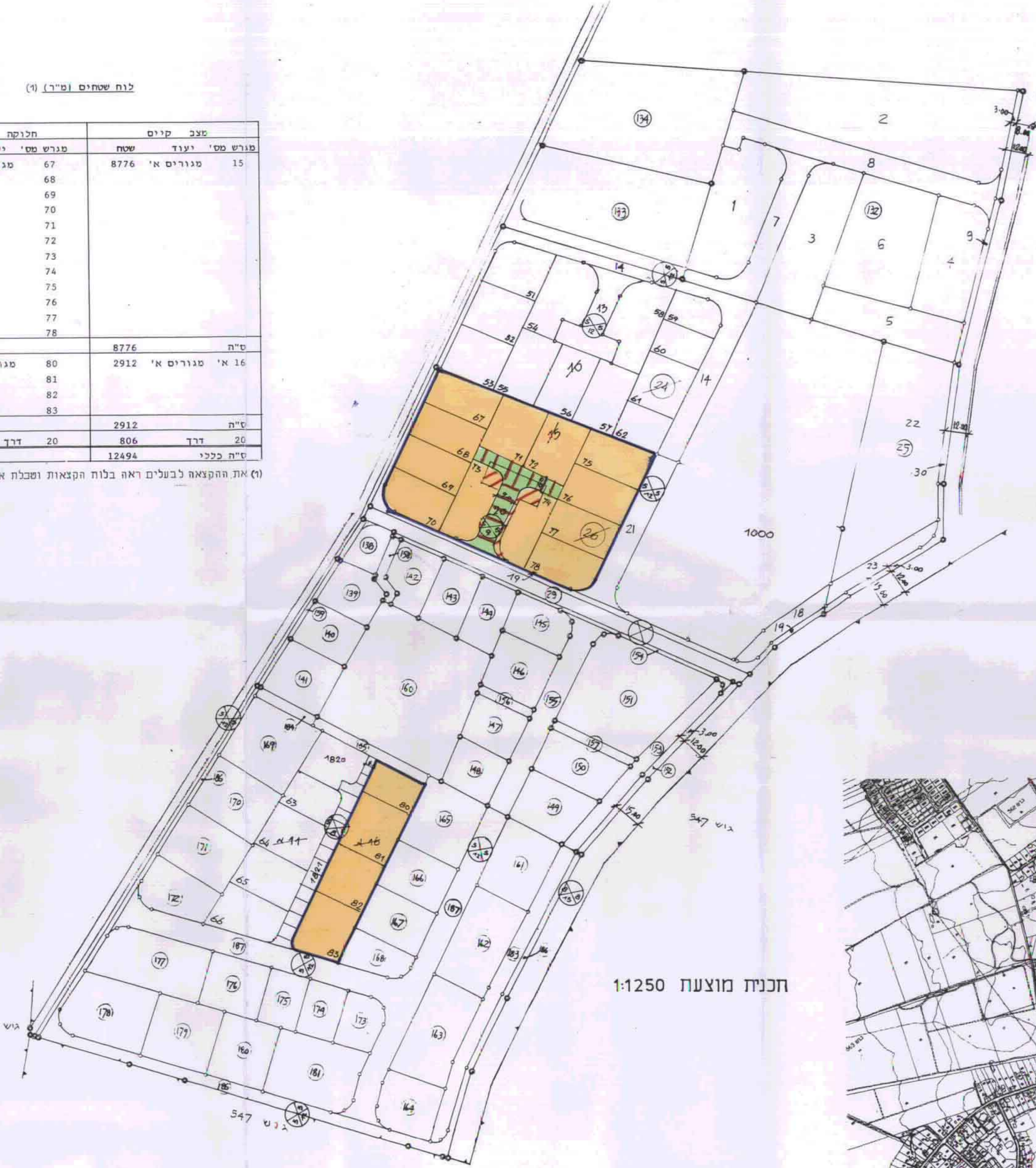
תכנית מוצעת 1:1250