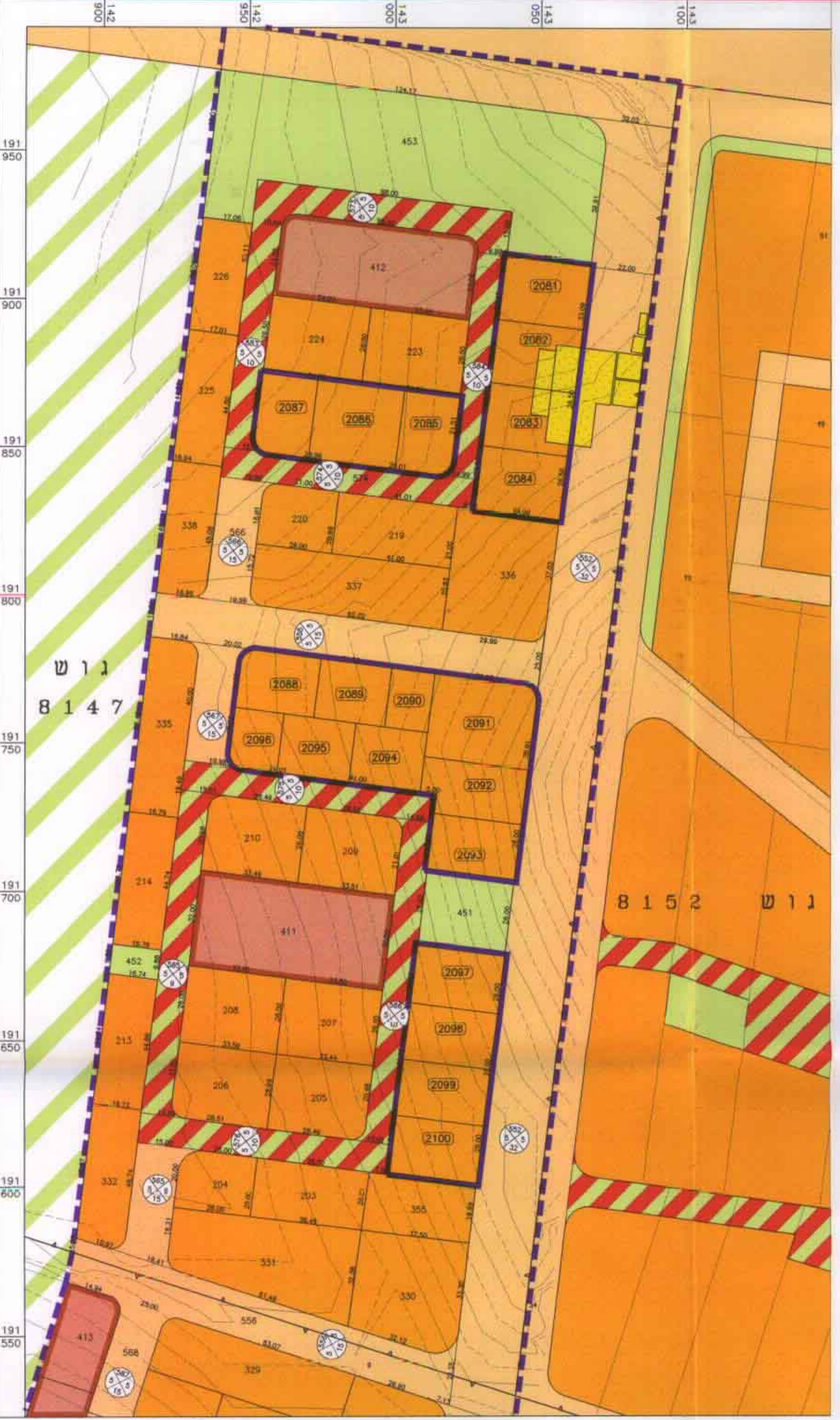
מצב מוצע 1:1250