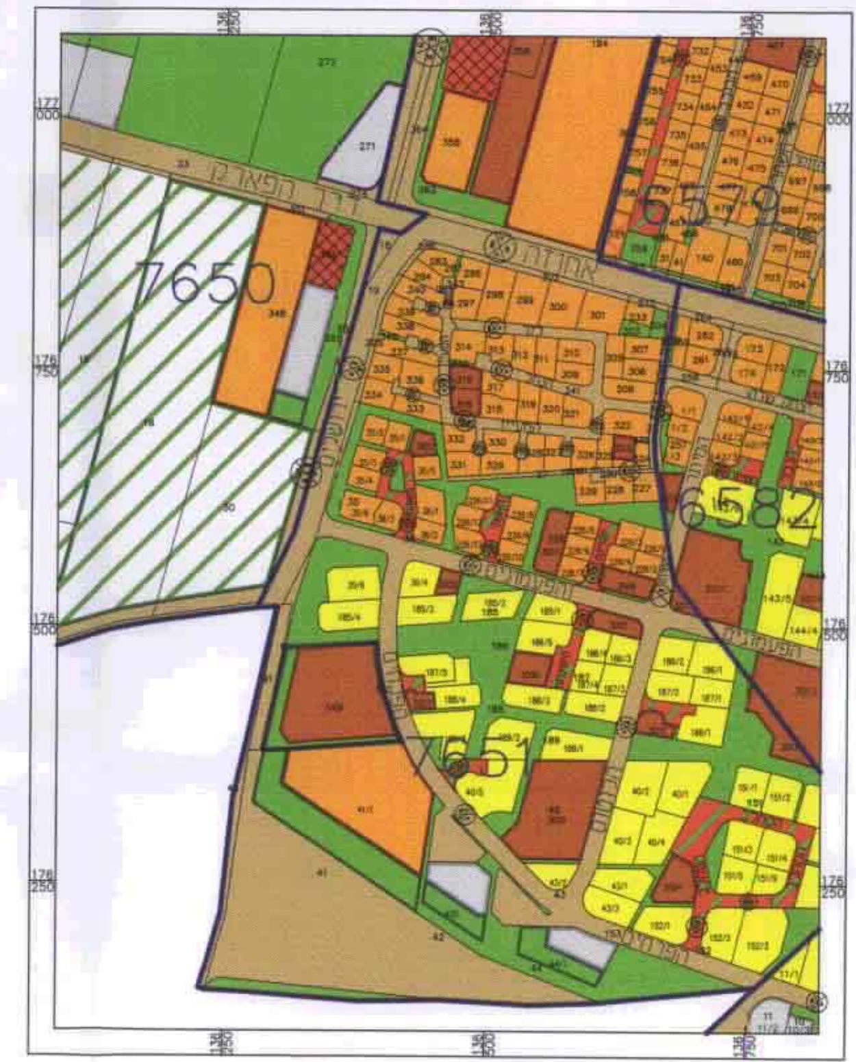
תרשים סביבה קנ"מ 1:5000