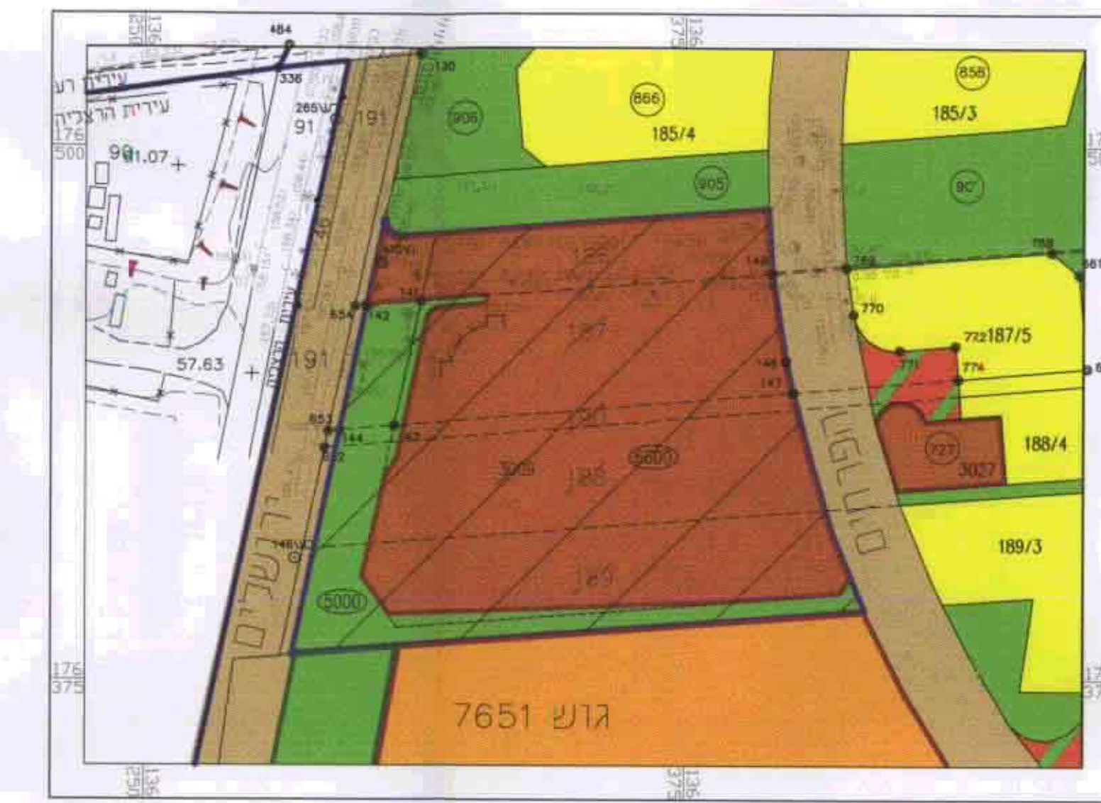
מצב מוצע קנ"מ 1:1250