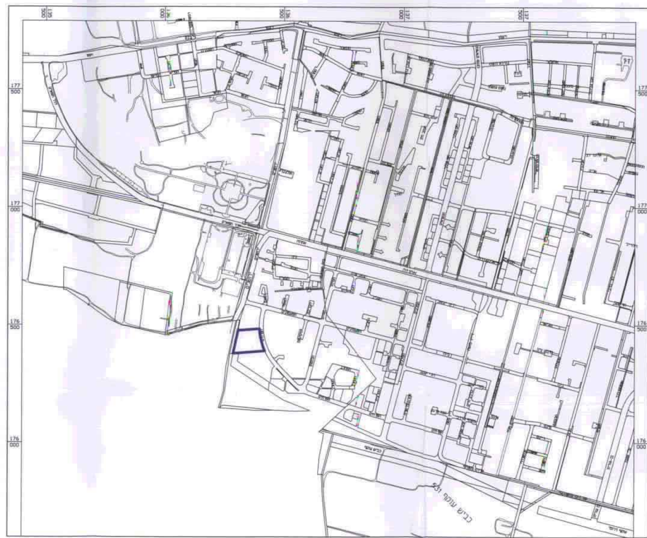
תרשים התמצאות קנ"מ 1:10,000