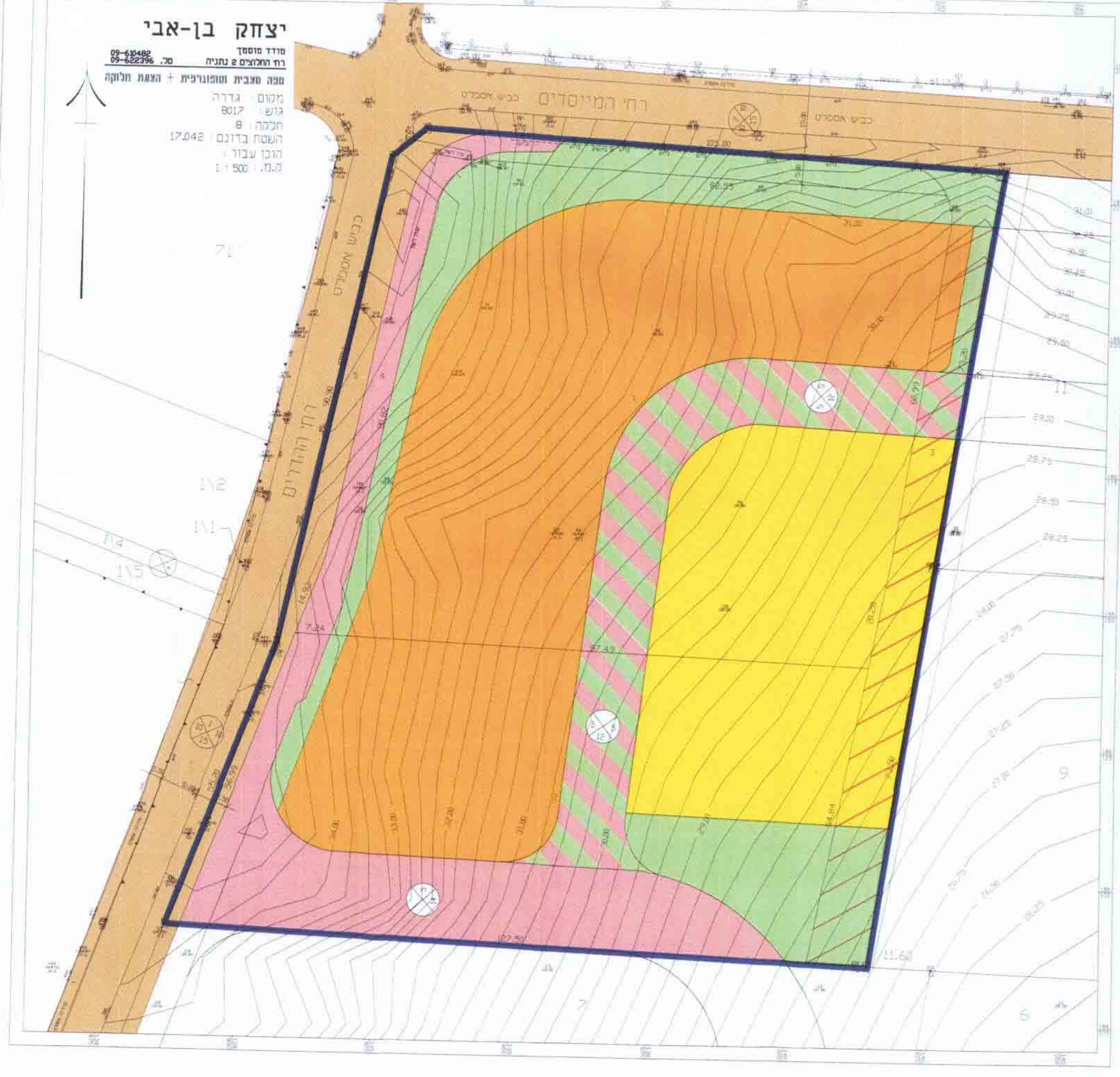
מצב מוצע ק.מ. 1:500

יצחק בן-אבי מודד מוסמך רח המלאכים 2 נתניה טל. 05-62296 05-62482