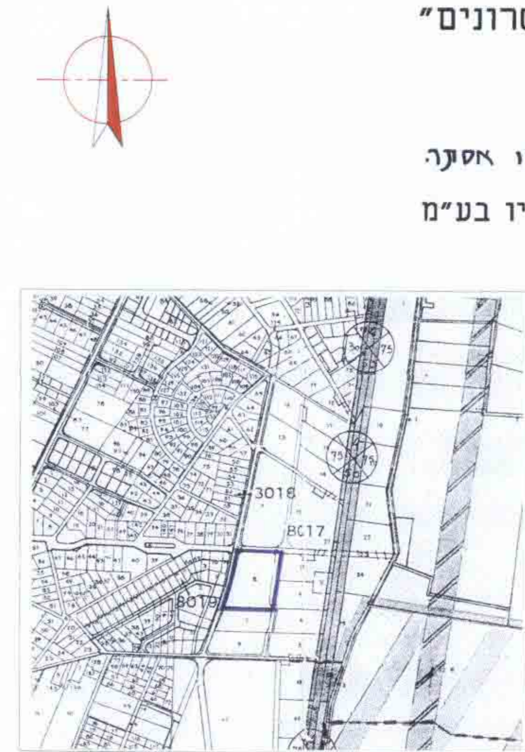
תרשים סביבה ק.מ. 1:10000