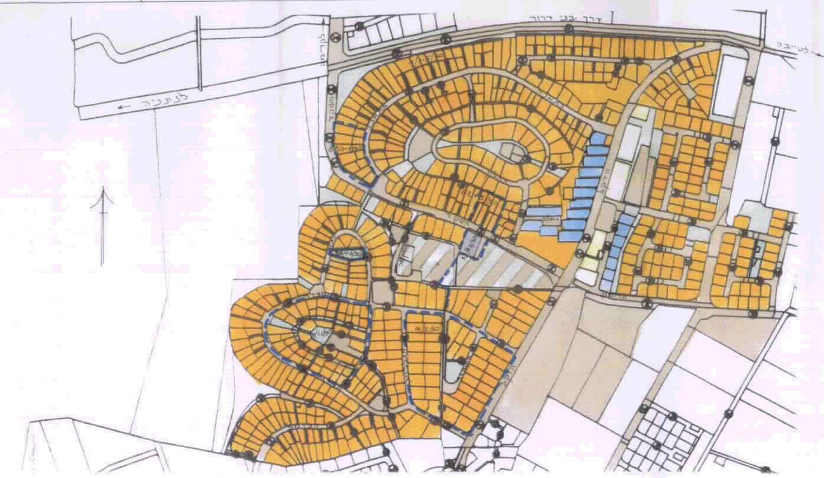
תרשים סביבה 1:5000