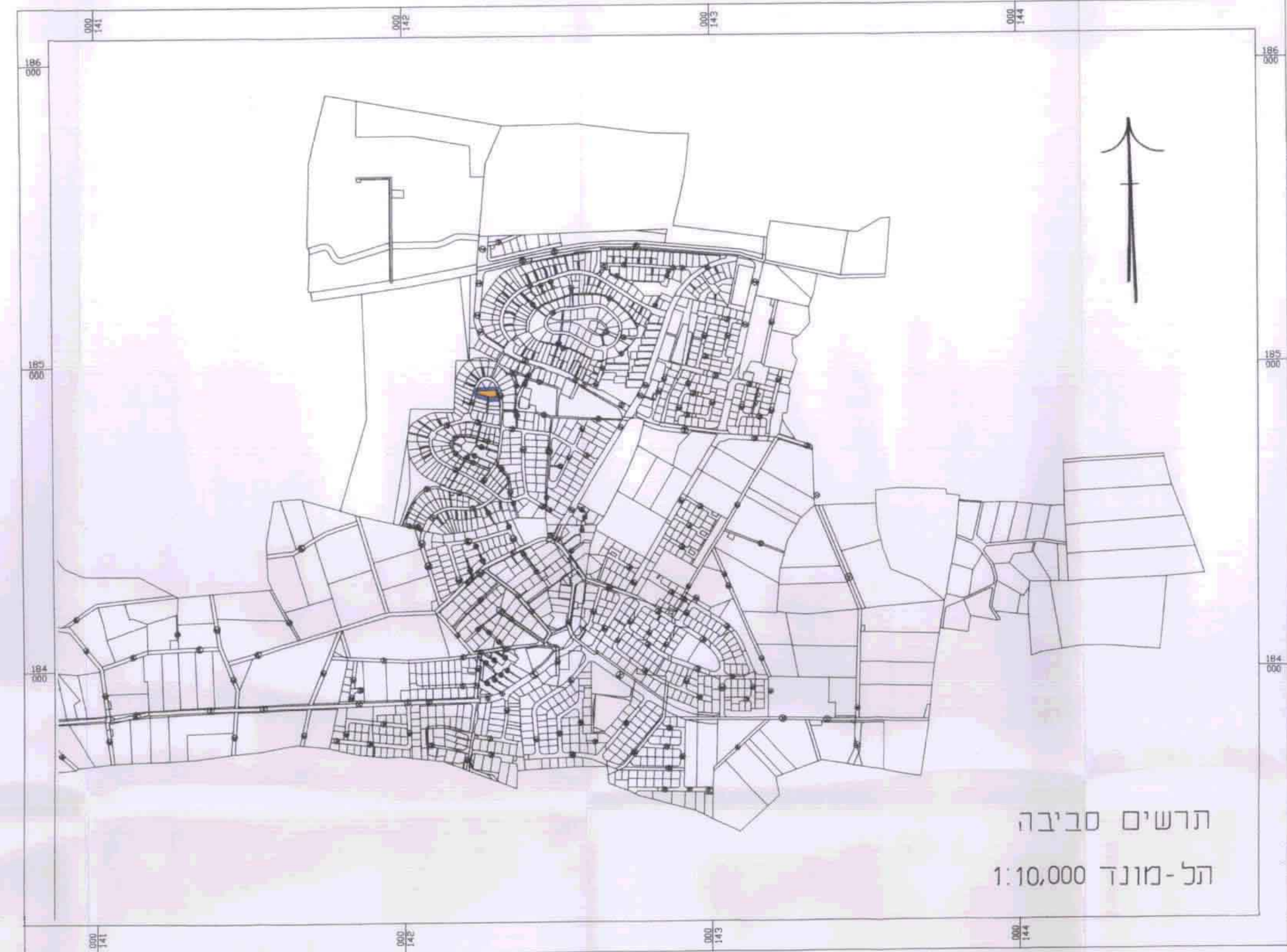
תרשים סביבה תל-מונד 1:10,000