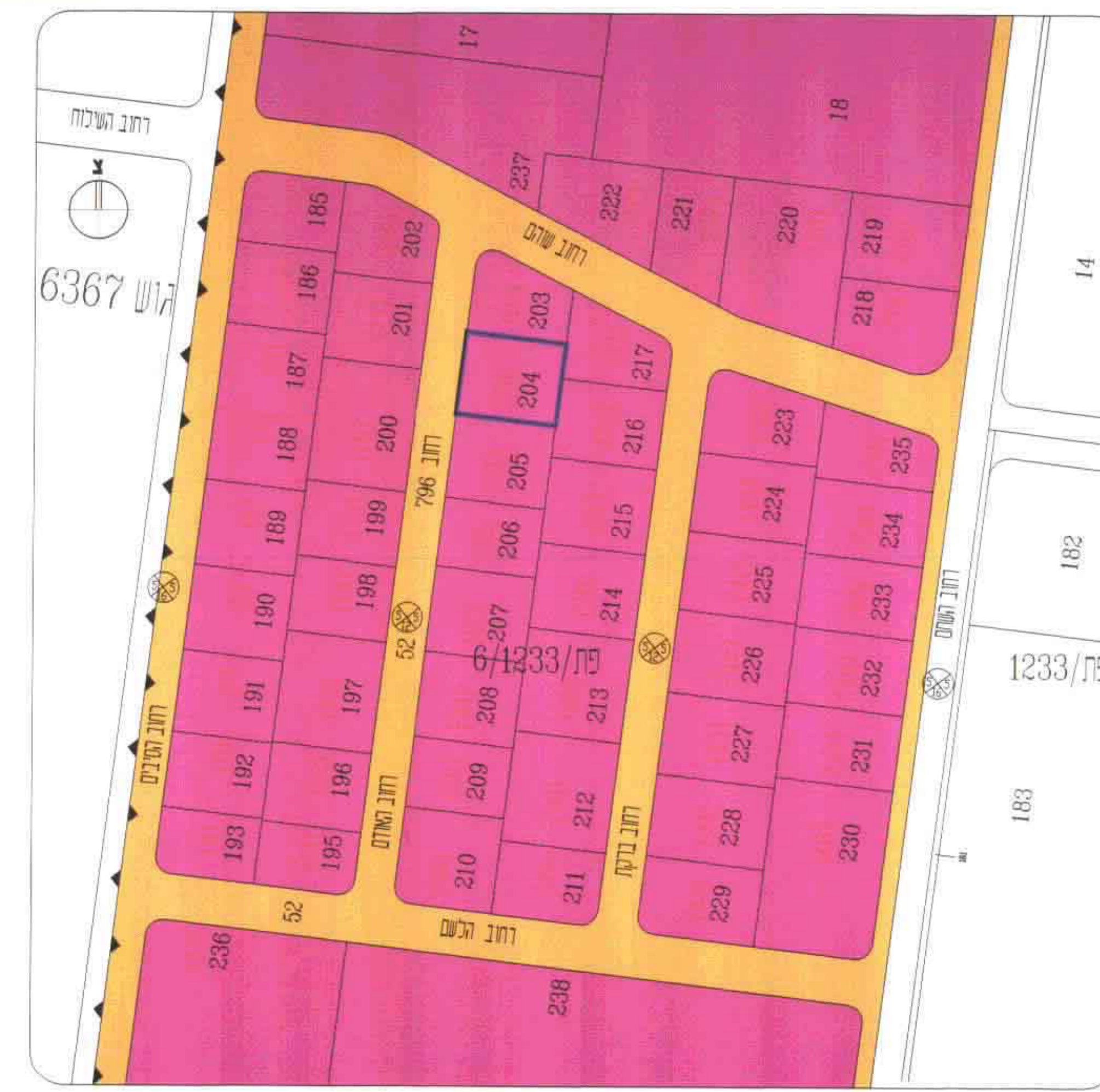
תרשים הסביבה קנ"ח 1 : 1250