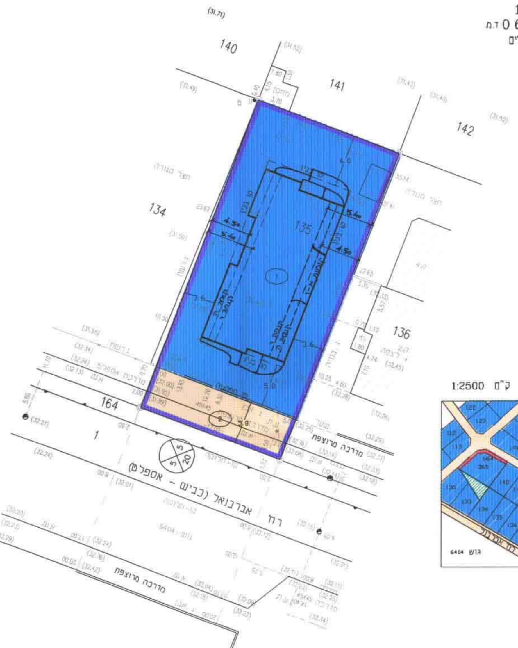
תרשים הסביבה ק"מ 1:2500

מחוז : מרכז נפה : פתח-תקה מקום : פתח-תקה גוש : 6355 חלקה : 135 שטח : 0.642 ד.מ. הוכן עבור : הבעלים