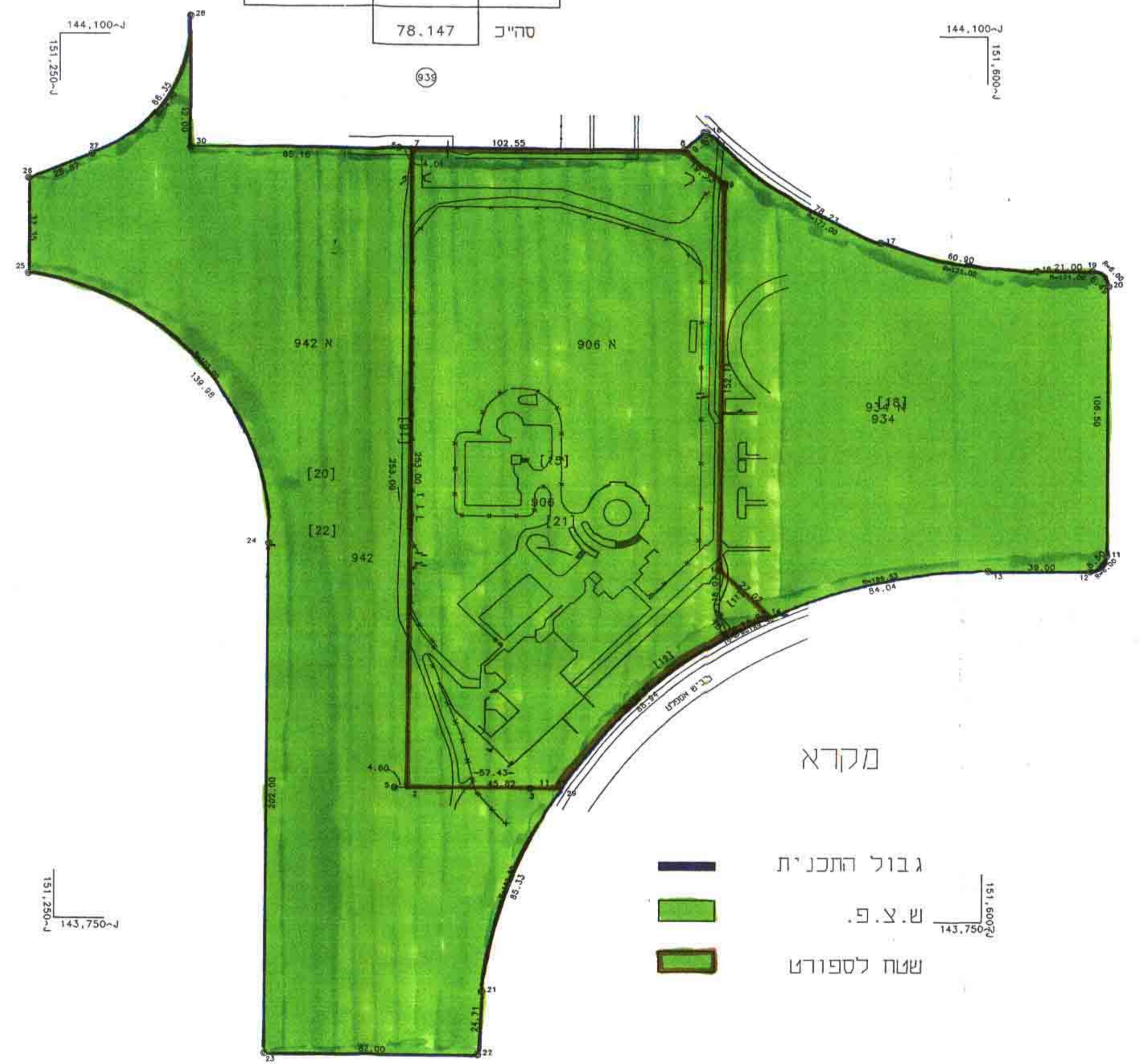
מצב מוצע ק.מ. 1:1250