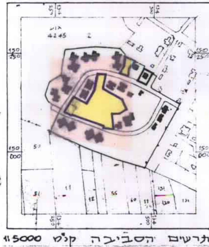
תרשים הסביבה ק"מ 1:5000