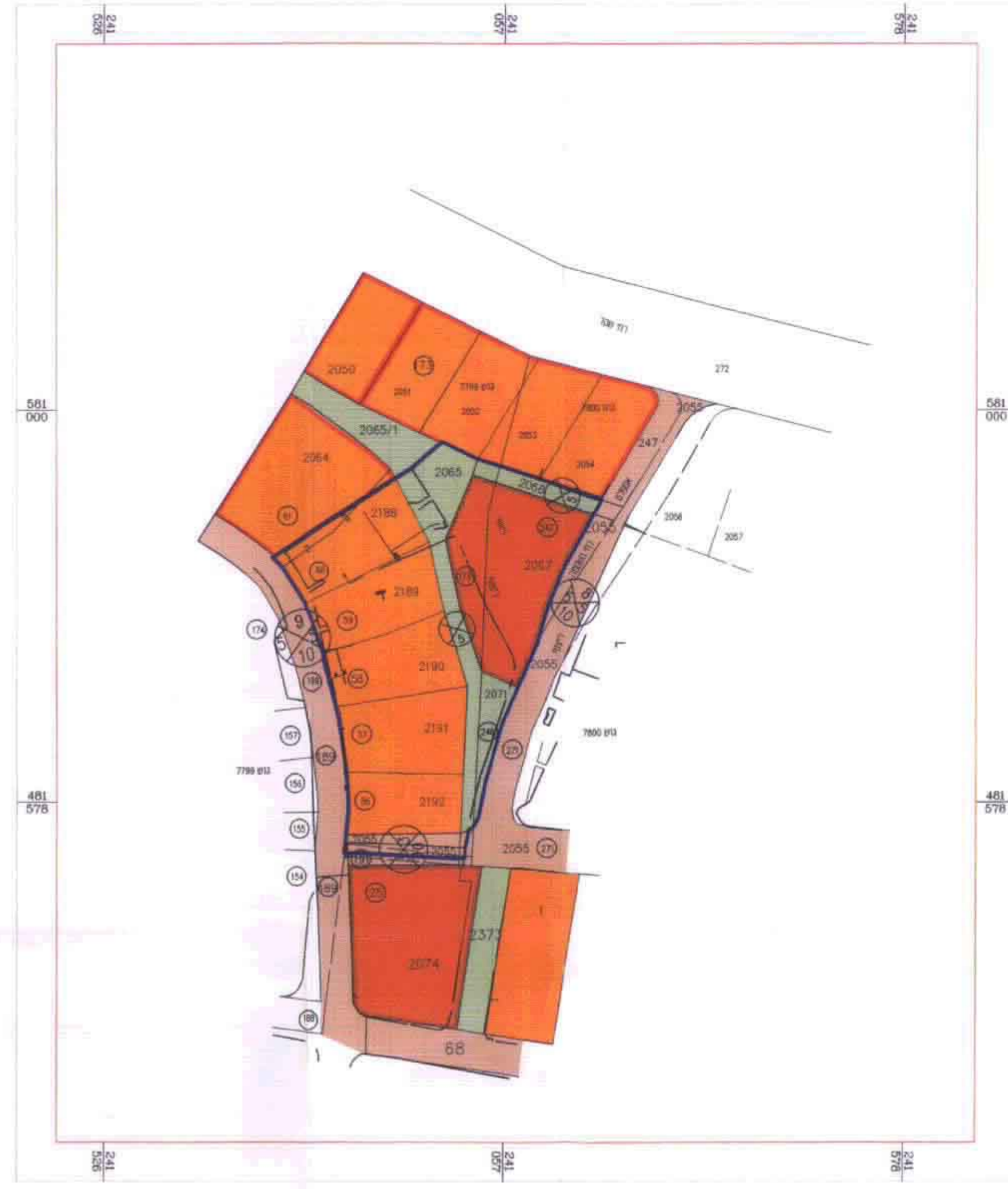
מצב קיים קנ"ם 1:1,250 עפ"י הצ/5-1-9 והצ/5-1-0