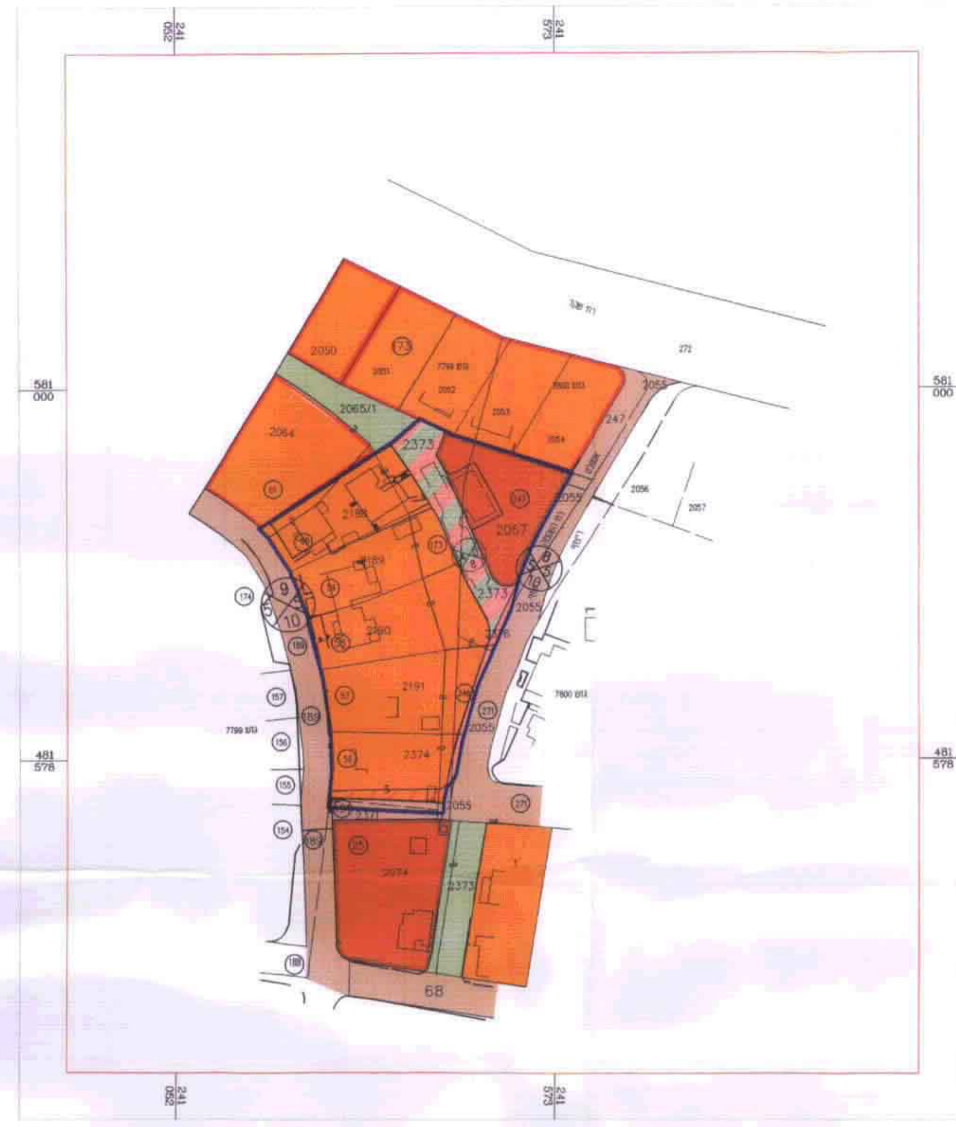
מצב מוצע קנ"ם 1:1,250