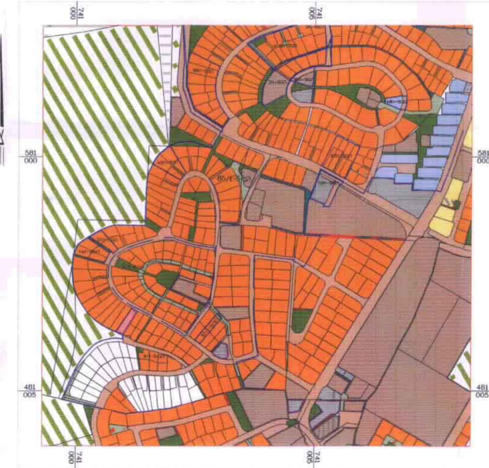
תרשים סביבה קנ"ם 1:5,000 עפ"י הצ/5-1-9 והצ/5-1-0