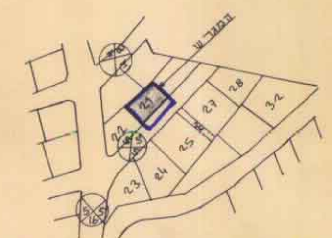
תרשים סביבה קמ 1:2500 לפי מ.מ. 318