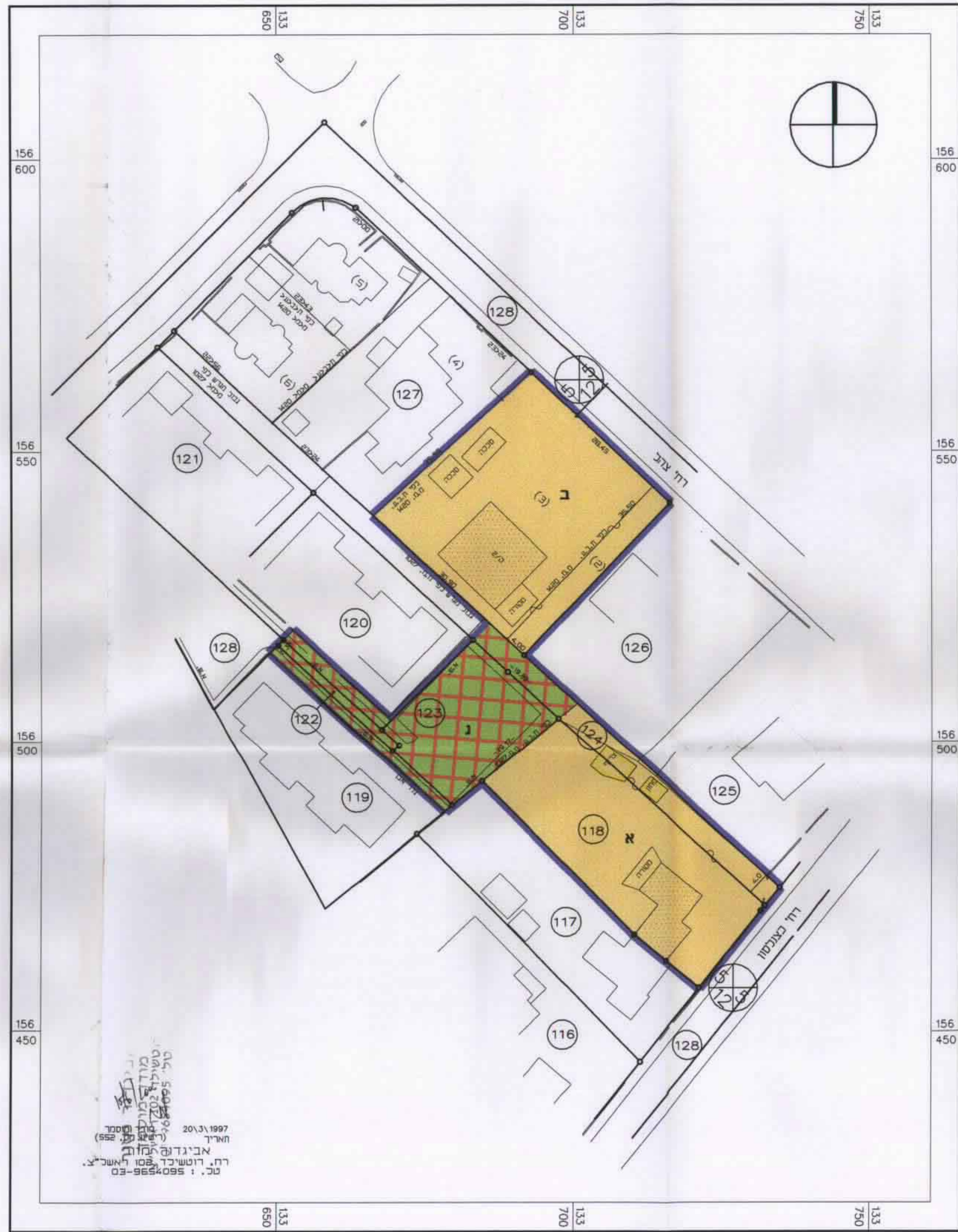
מצב מוצע 1:500