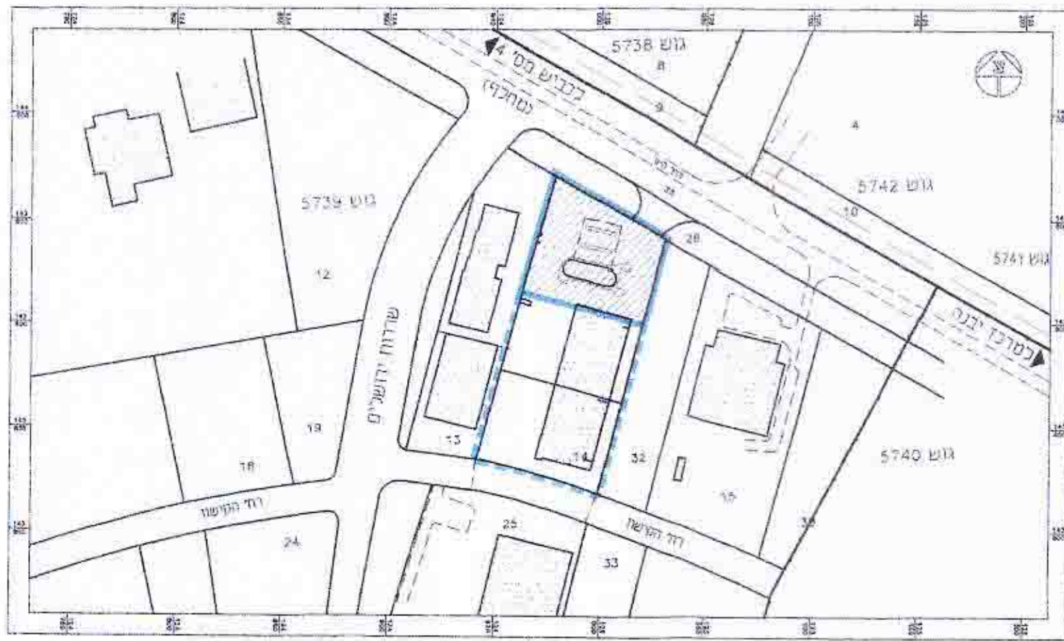
תכנית סביבה 1:2500