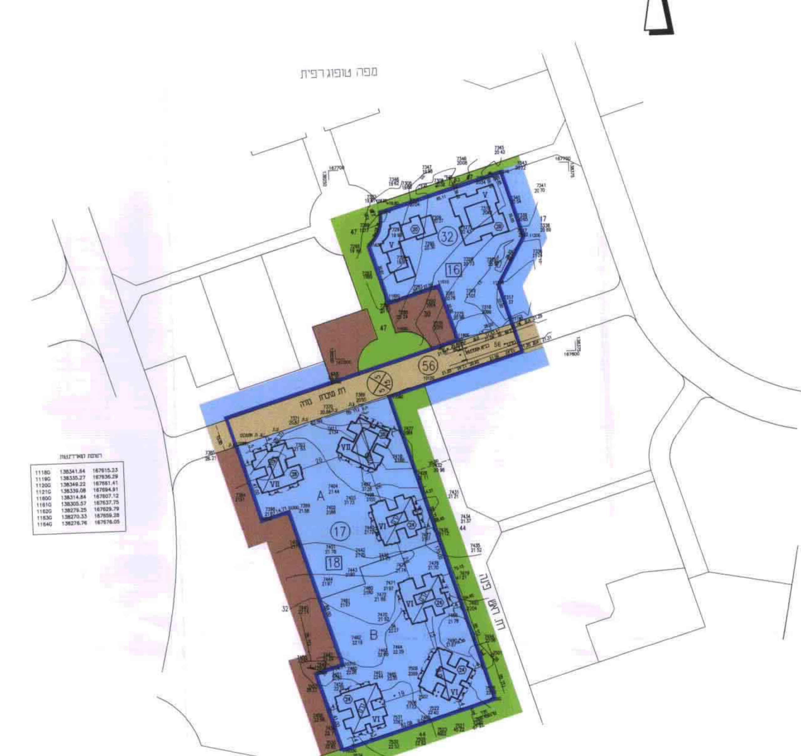
מצב קיים קב. 1 / 1250