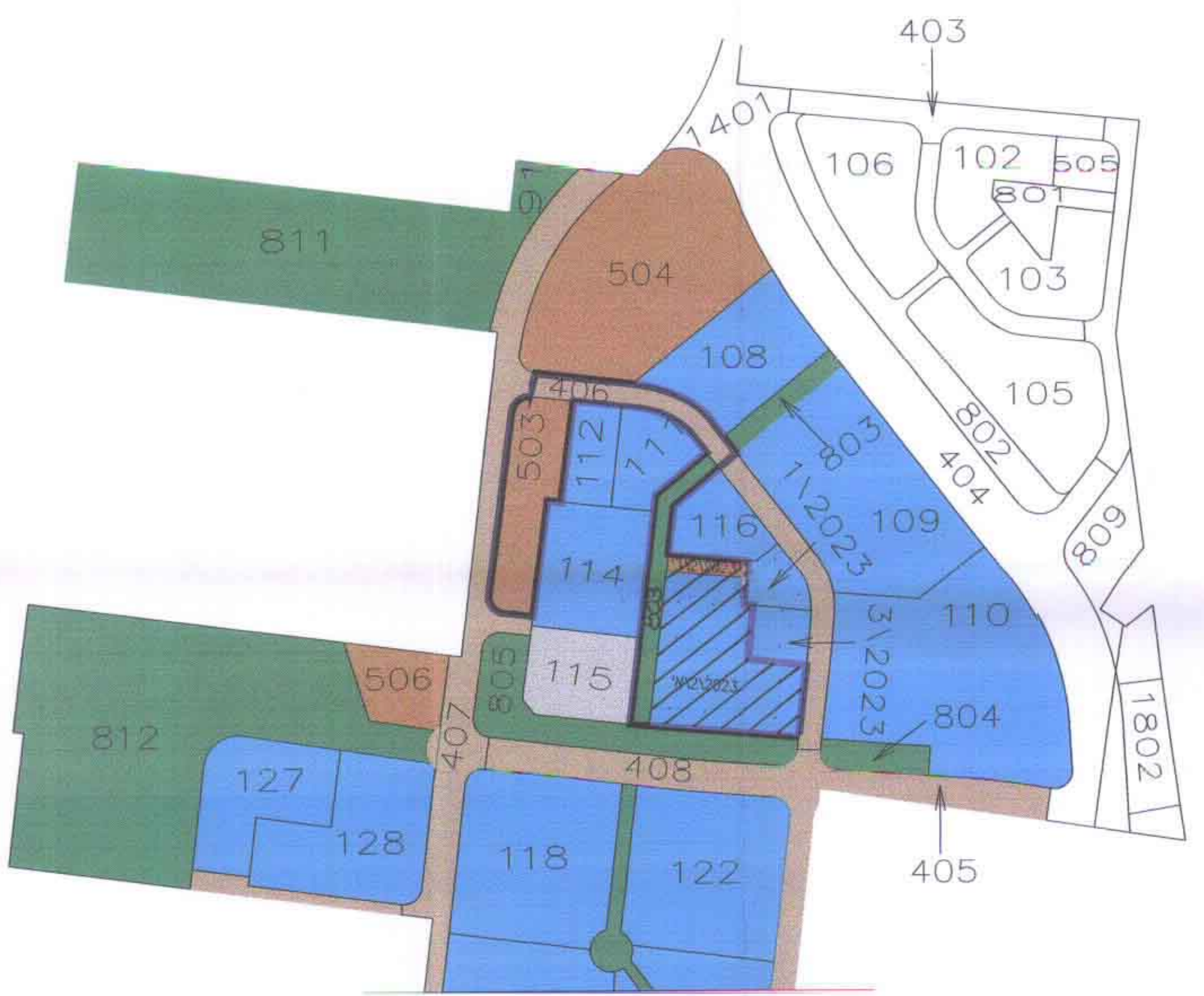
תרשים סביבה+מצב מוצע ק.מ. 1 : 2500