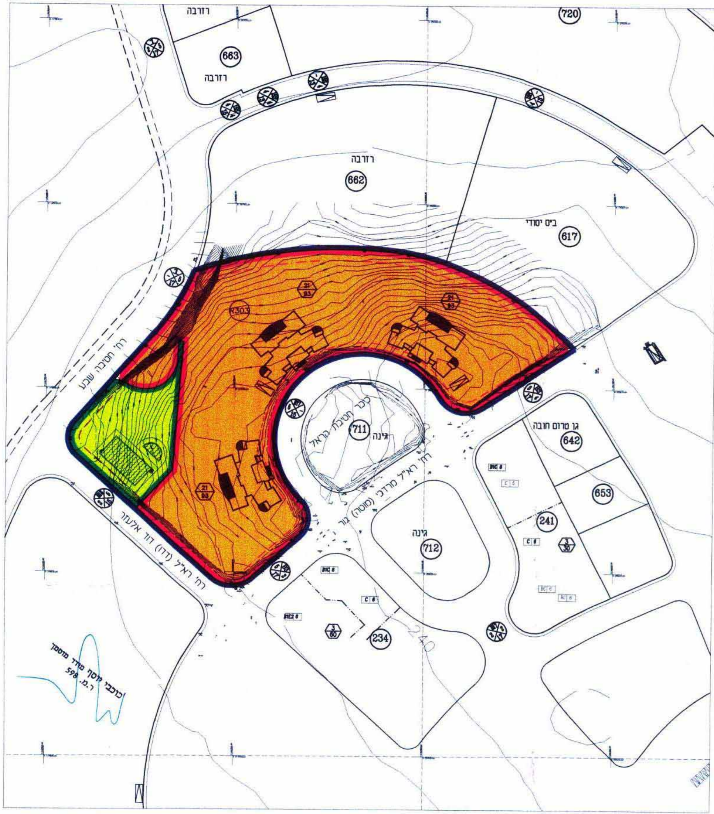
מצב מוצע 1 : 1250