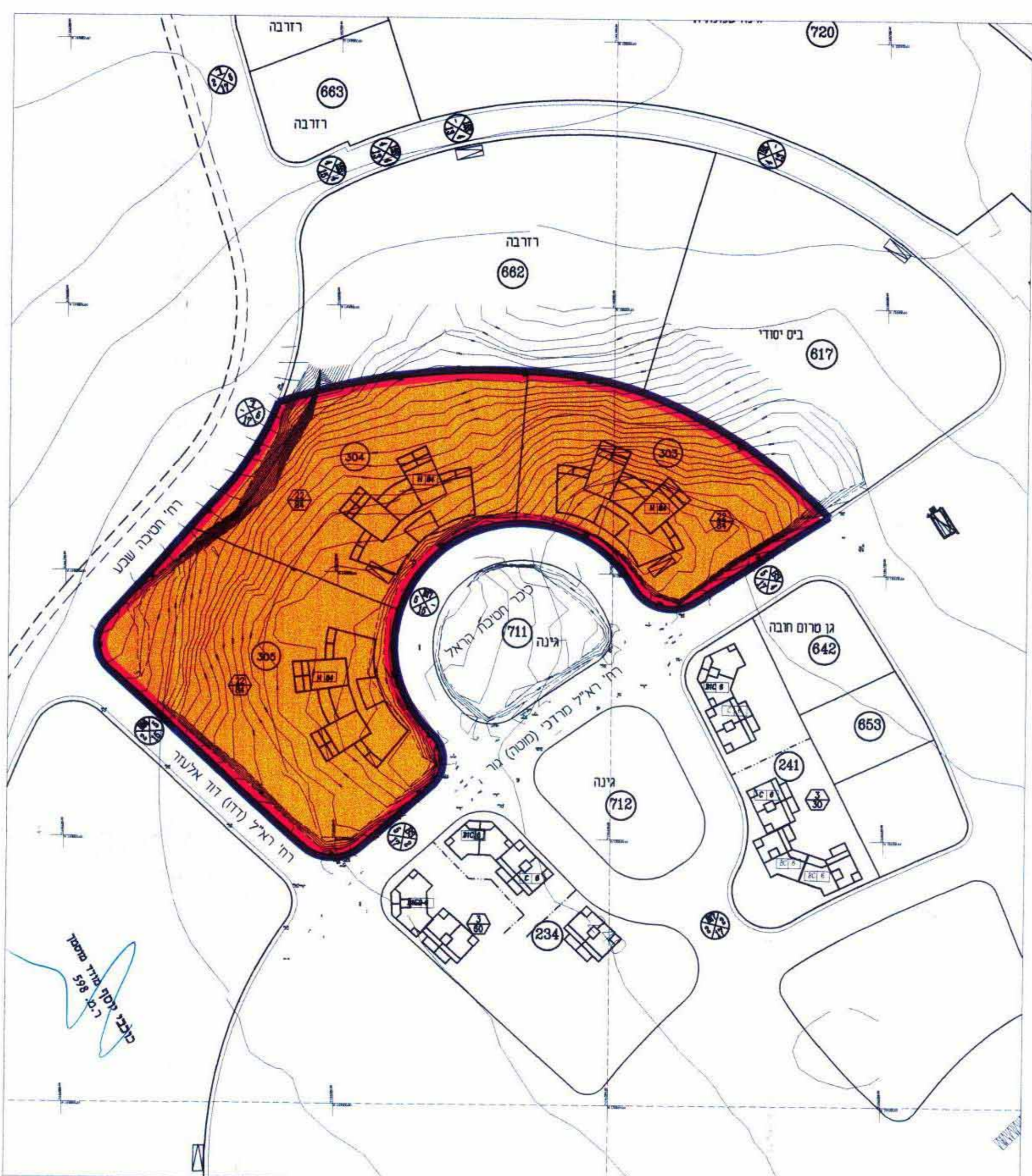
מצב קיים 1 : 1250