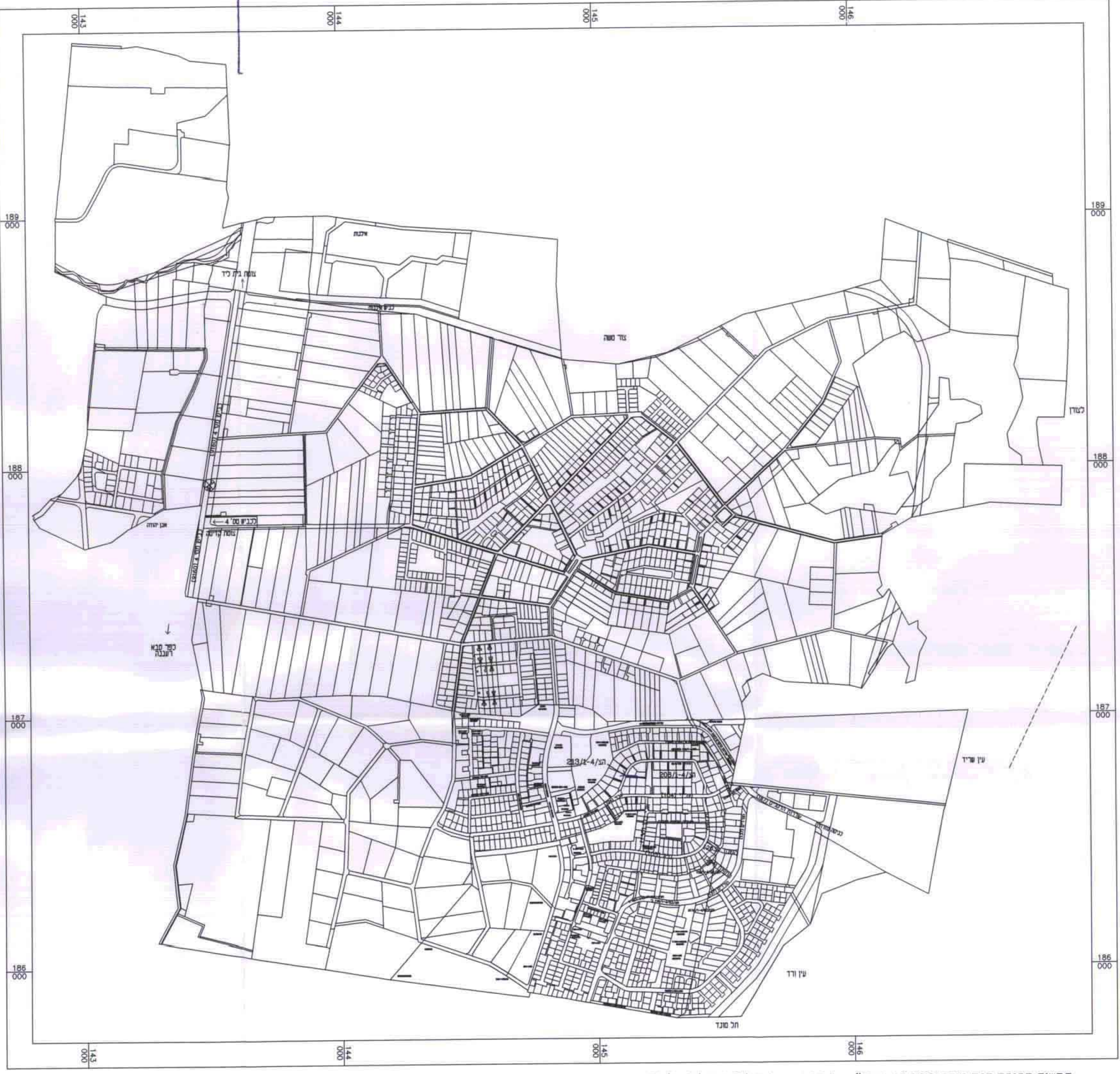
תרשים סביבה קנה מידה 1:10000 עפ"י הצ/130 ו-1/17/3 ו-הצ/4-61/1

חוק התכנון והבניה תשכ"ה-1965 הועדה המקומית לתכנון ובניה שרונים תכנית שינוי מתאר הצ/4-130/1-4-213/1 בסמך חוק מנכ"ס הועדה י"ר העדה