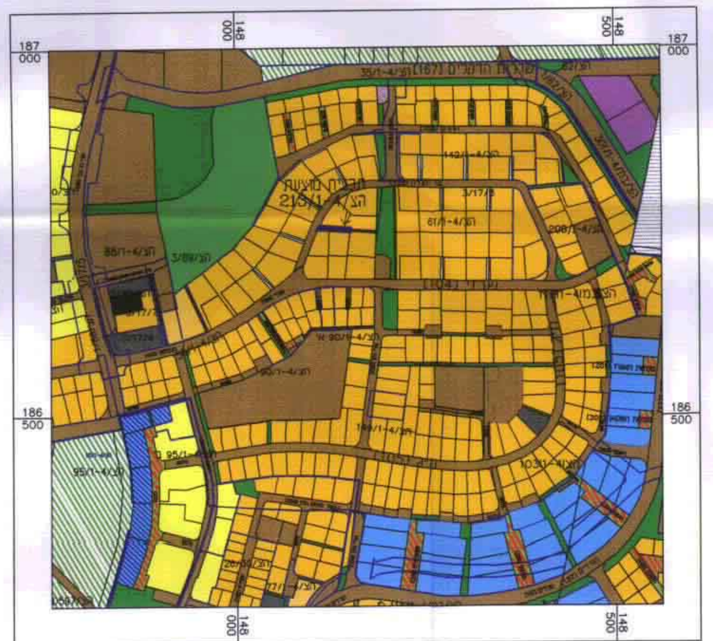
תרשים סביבה קנה מידה 1:5000 עפ"י הצ/130 ו-הצ/4-61/1