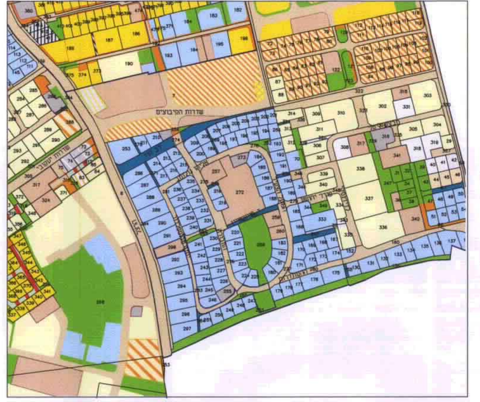
תכנית סביבה קני'מ 1:5000