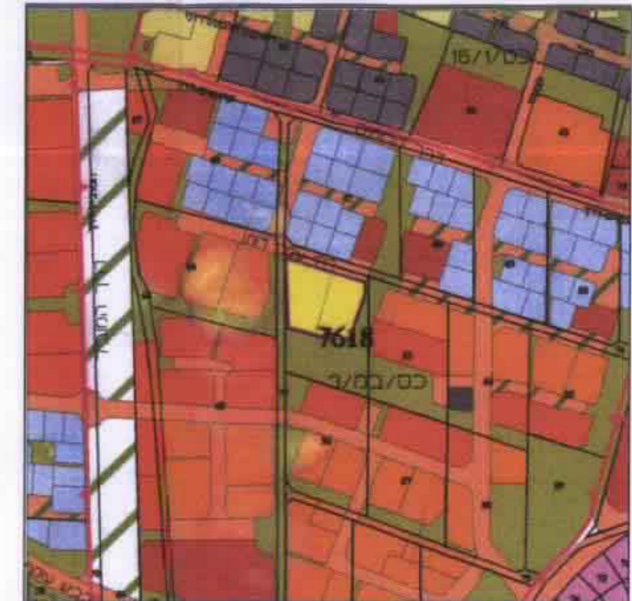
תרשים סביבה 1:5000

חוק התכנון והבניה תשנ"ה - 1994 מודד מדידות והנחה בע"מ חתימת המודד: יאיר אבראל 3 ת"א 6970 חתימת היום חתימת המחכנו