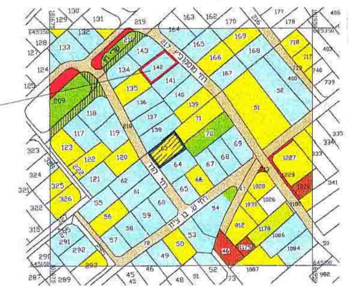
תרשים סביבה קנ"מ 1:2500

הערות: 1. החוכנה מבוססת על מפת הגוש 2. המספרים בסגריים הם גבהים קיימים הקשורים לרשת הגבהים העירונית.