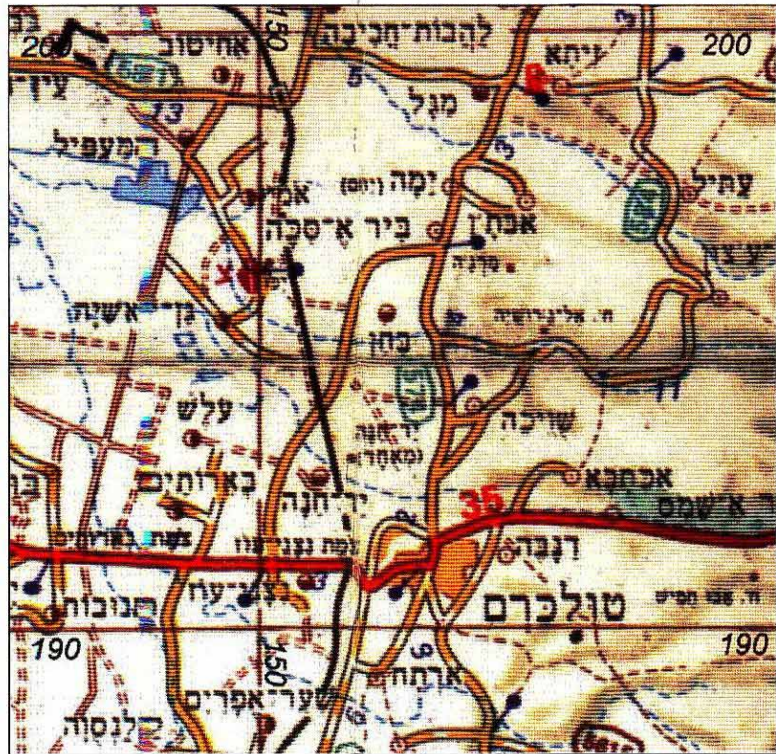
תרשים סביבה ק.מ. 1:30000