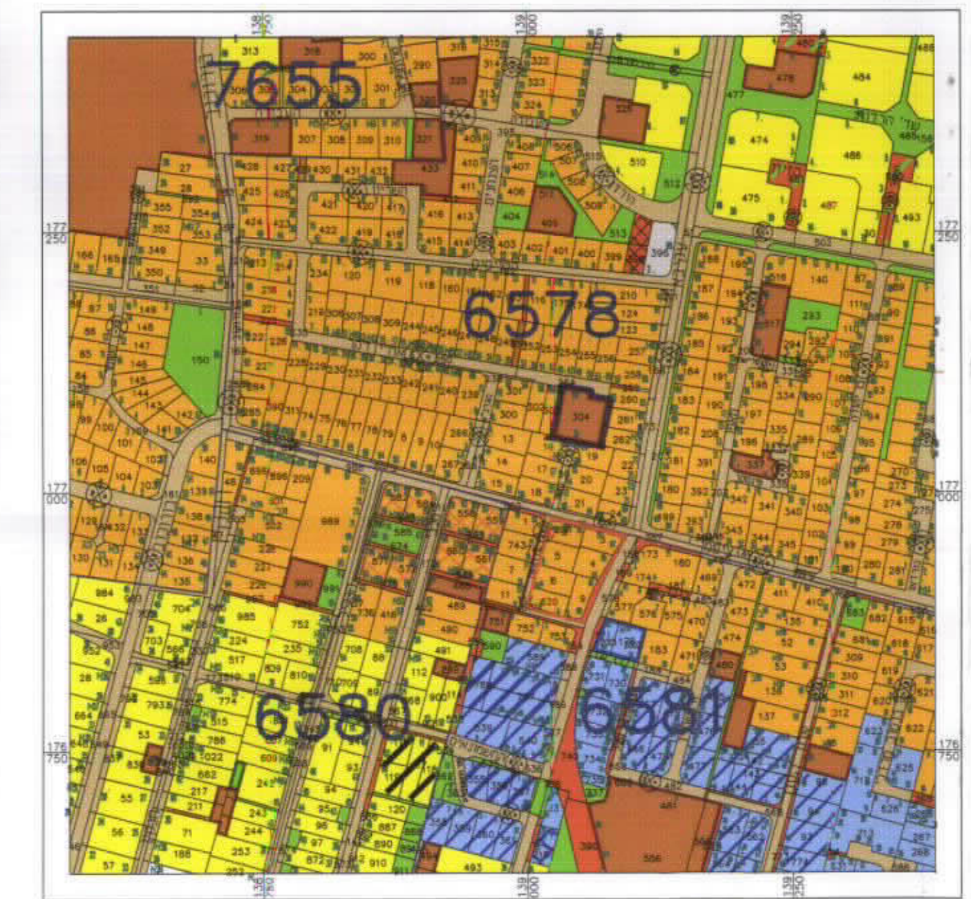
תרשים סביבה קנ"מ 1:5000

חוק התכנון והבניה תשכ"ח 1965 ועדת משנה לתכנון ולבניה רעננה תכנית 151/רע'ב' בשיבת מס' 2000/2002 מיום 26.06.02 הודעה אשכול גלילי מנכ"ל