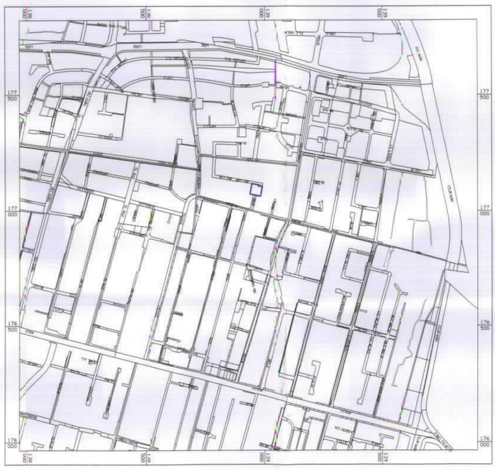
תרשים התמצאות קנ"מ 1:10,000