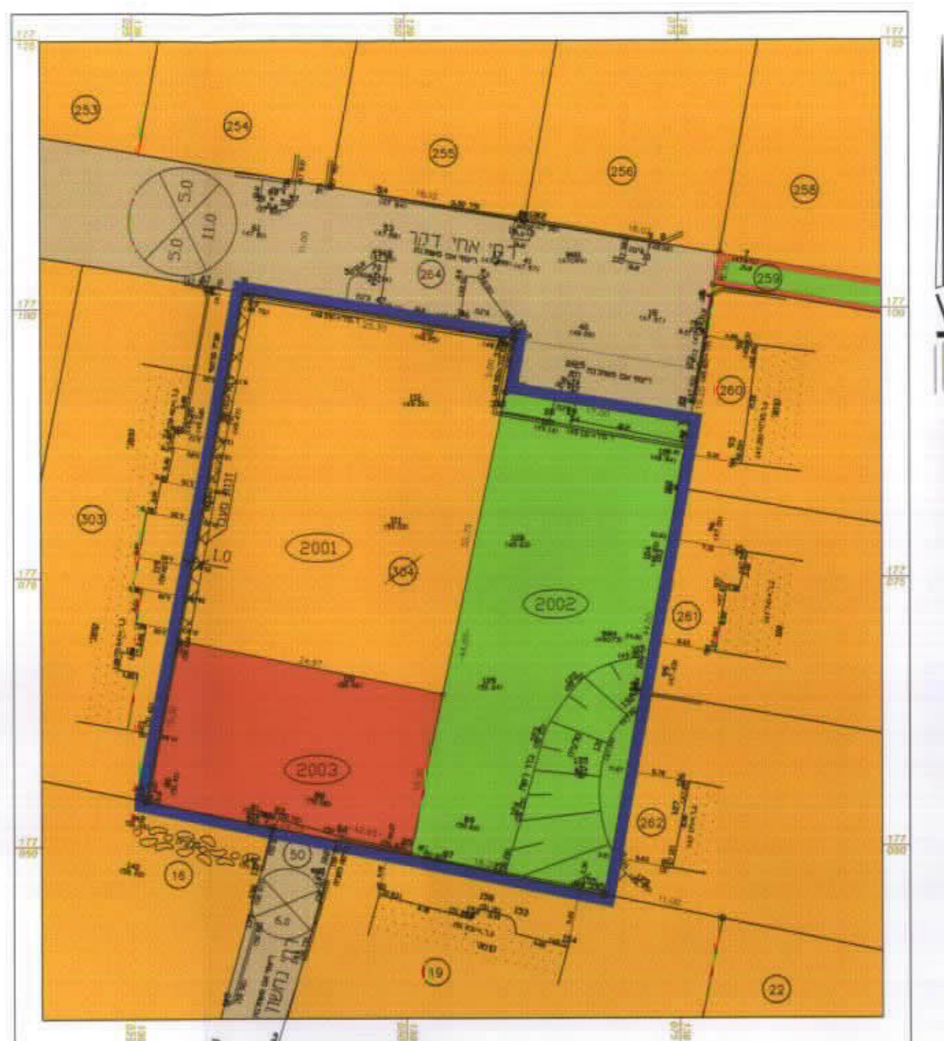
מצב מוצע קנ"מ 1:500