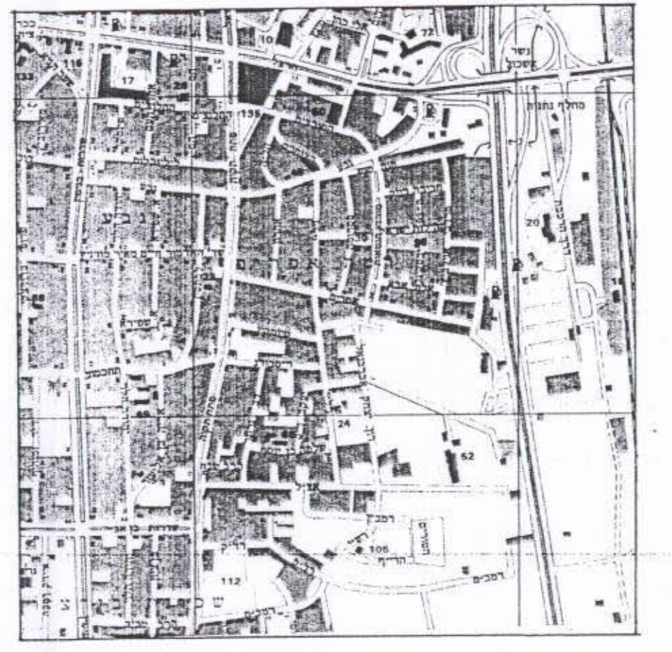
תרשים התמצאות קנ"מ 1:2500

הדסה המתכנן: מרסן-אפשטיין אודיבילם רח' בתר סוגרניה, סל 41855-09 הדסה ההוזם/ המגיש: דוד בן זק הדסה בעל הקרקע: אלי במילה, יוסף במילה, רנאל מייזן