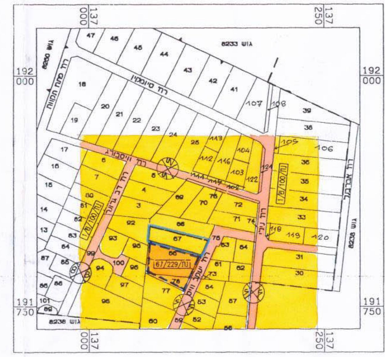
תרשים הטבייה קנ"מ 1:2500