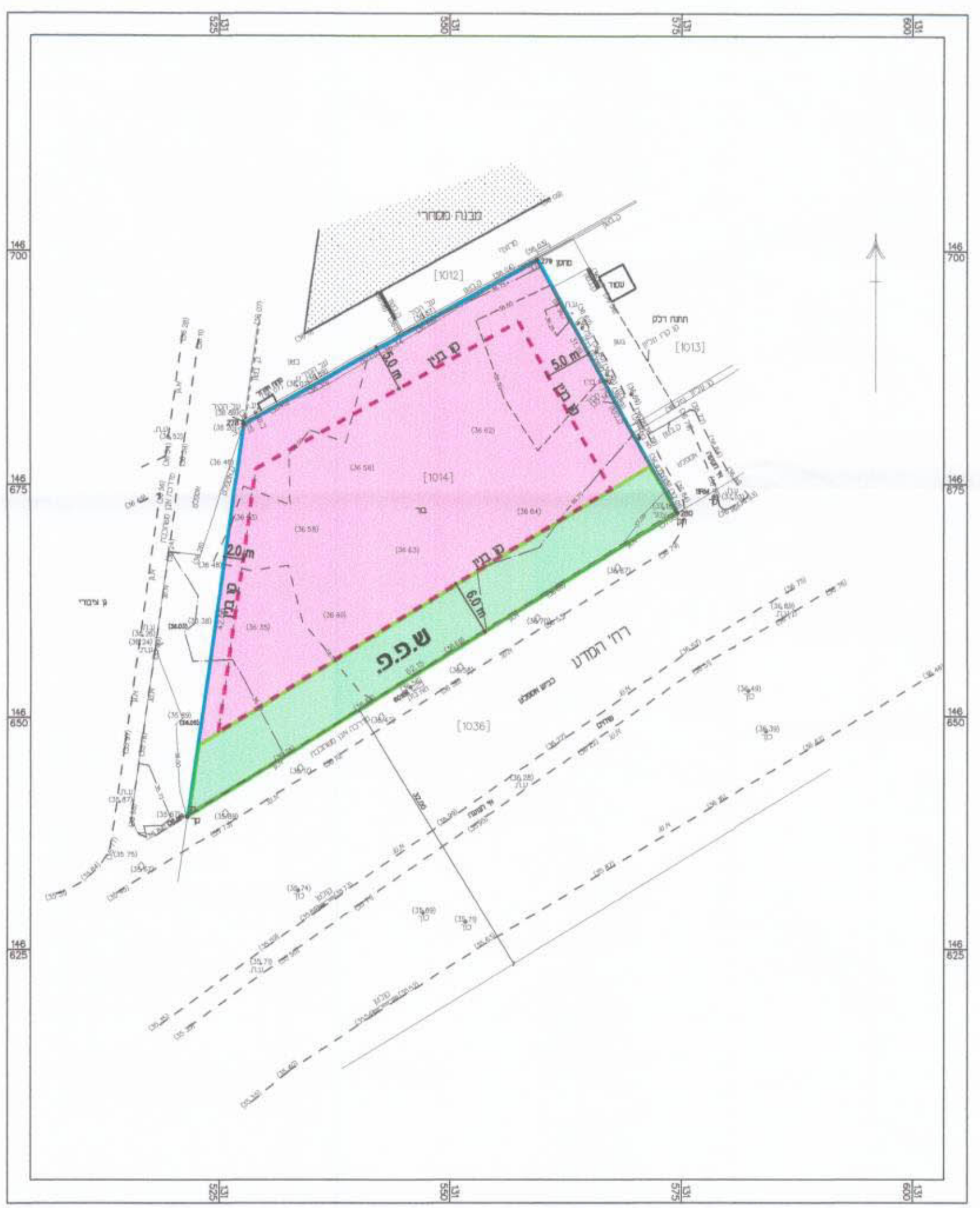
תכנית מצב מוצע 1:500