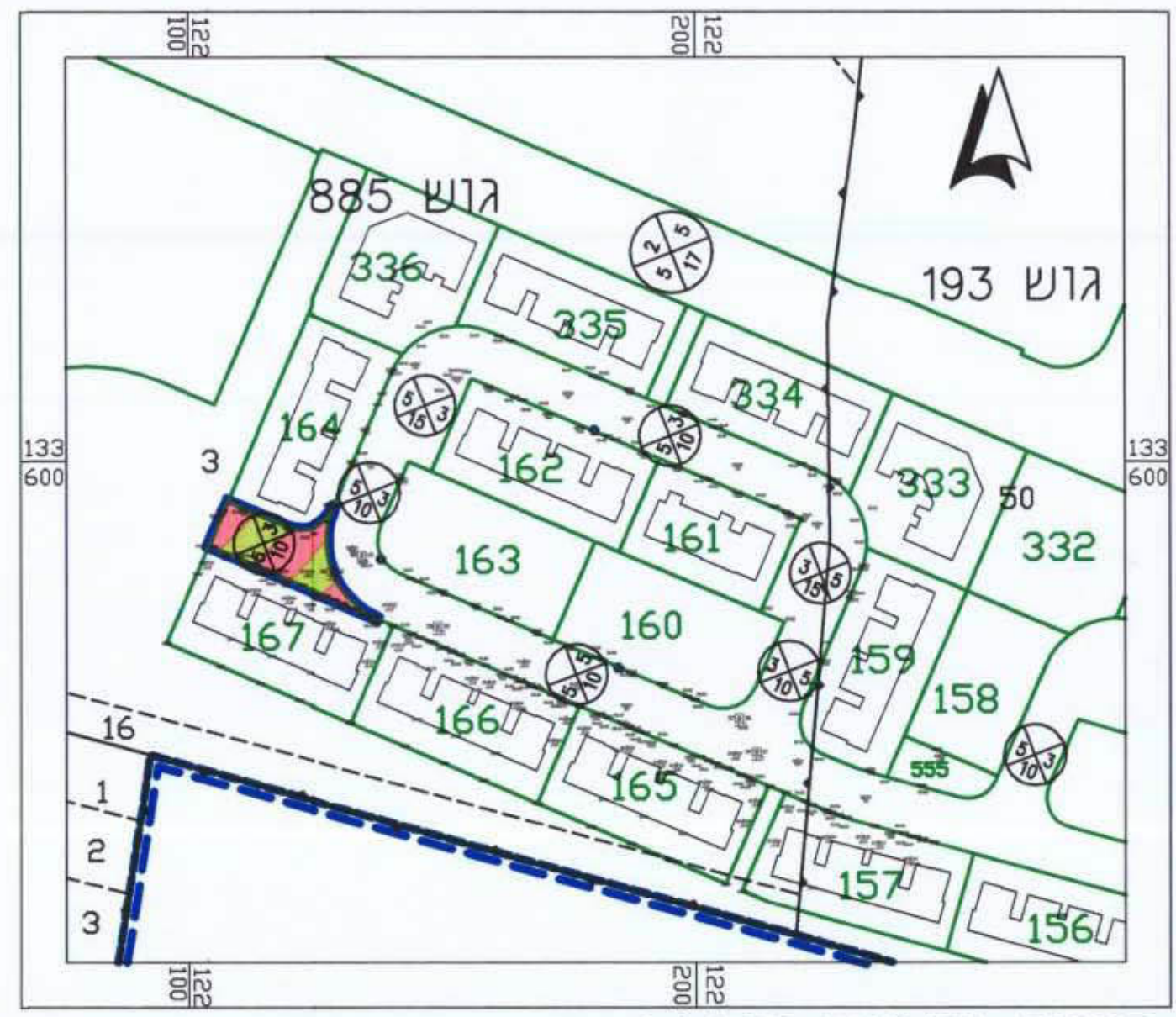
תכנית מוצעת 1:1,250