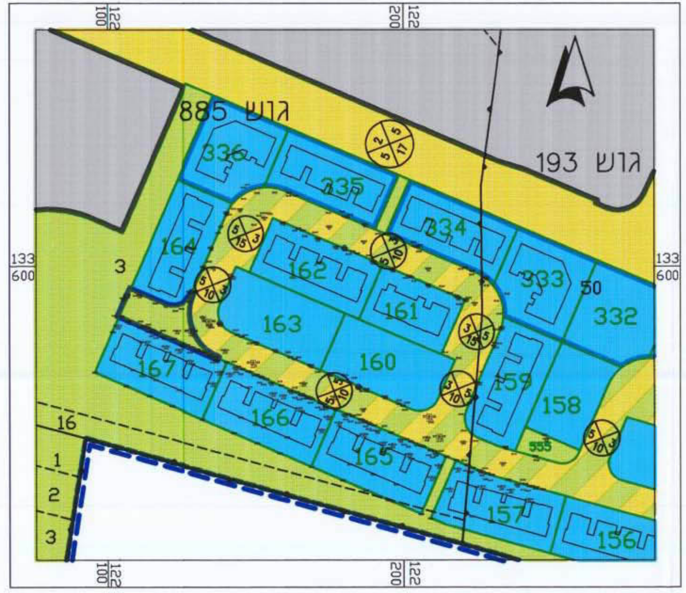
מצב קיים 1:1,250