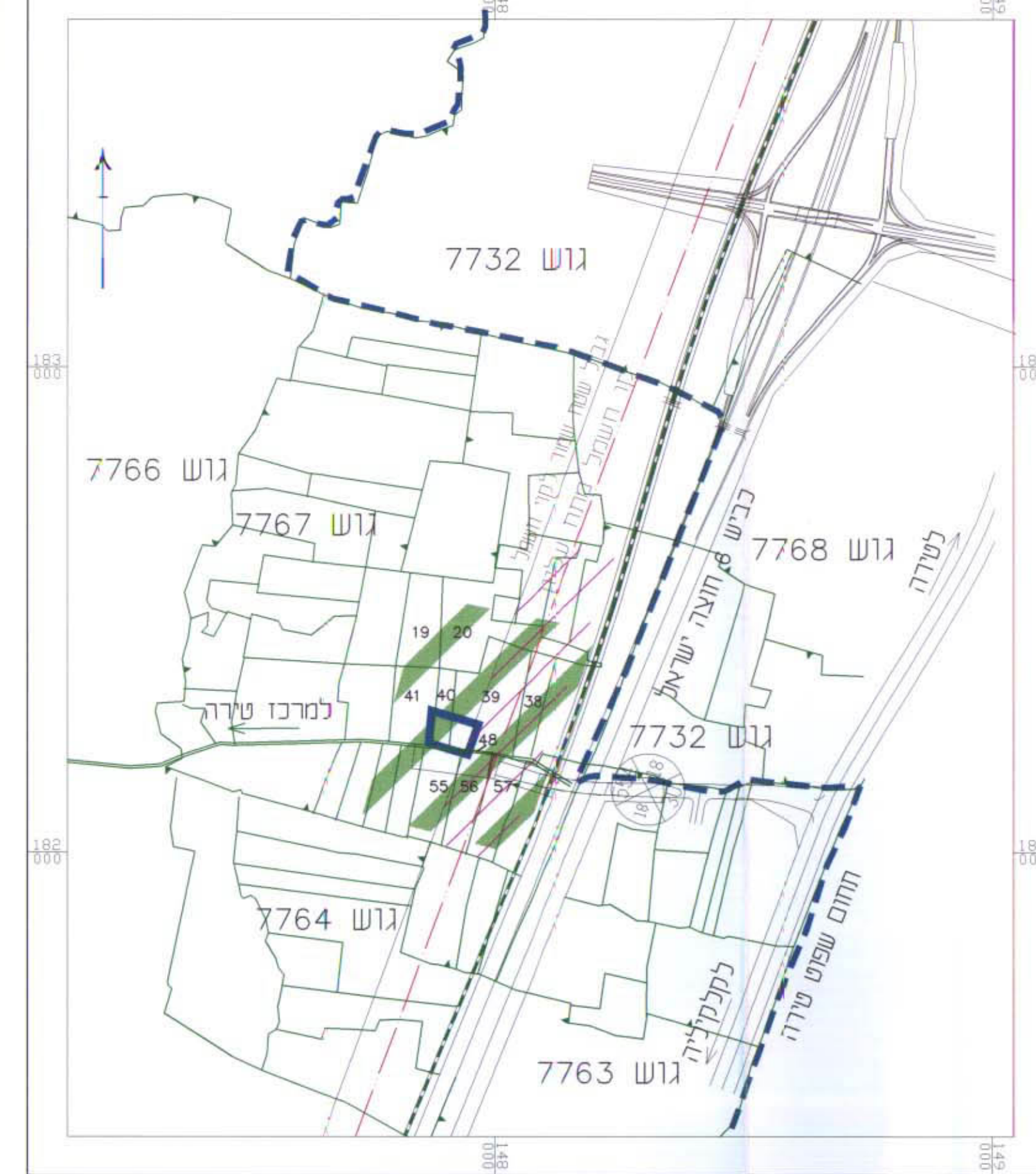
תרשים סביבה קנ"מ 1:10000

תאריך - 14.12.98, 8.12.98 02.01.01, 15.04.99