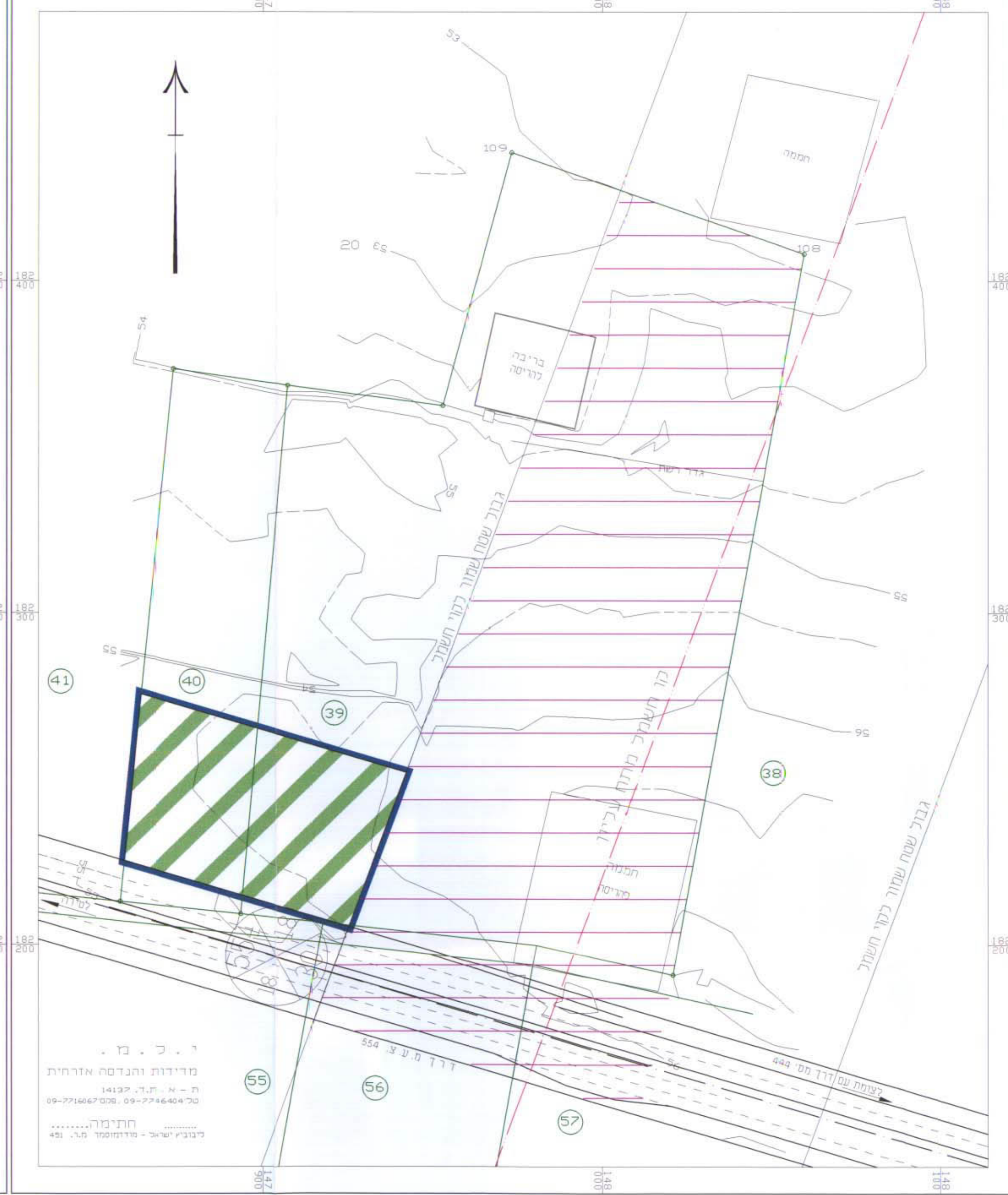
מצב קיים קנ"מ 1:1000