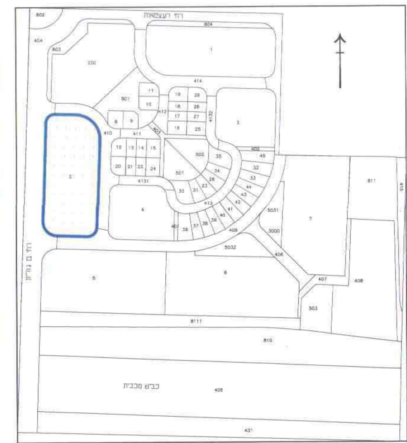
תורשים לביבה 1 / 2500

דודו גולדוס יורטל זבונה ערים 57516 רמי שריר הנדסה בניה והשקעות פלמ"ס