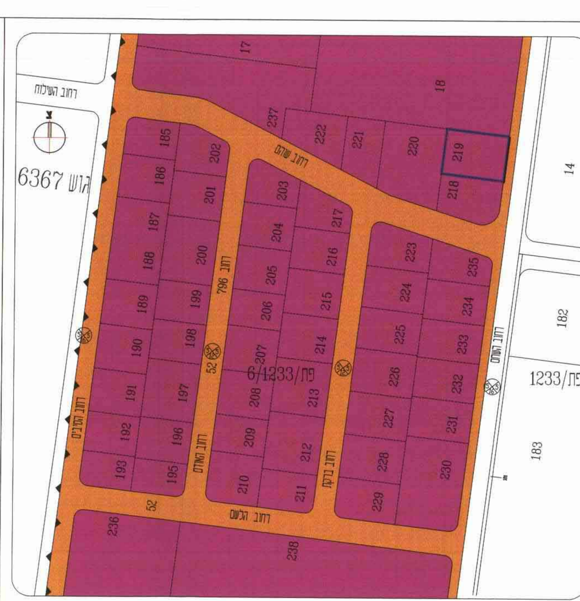
תרשים הסביבה קני"מ 1:1250