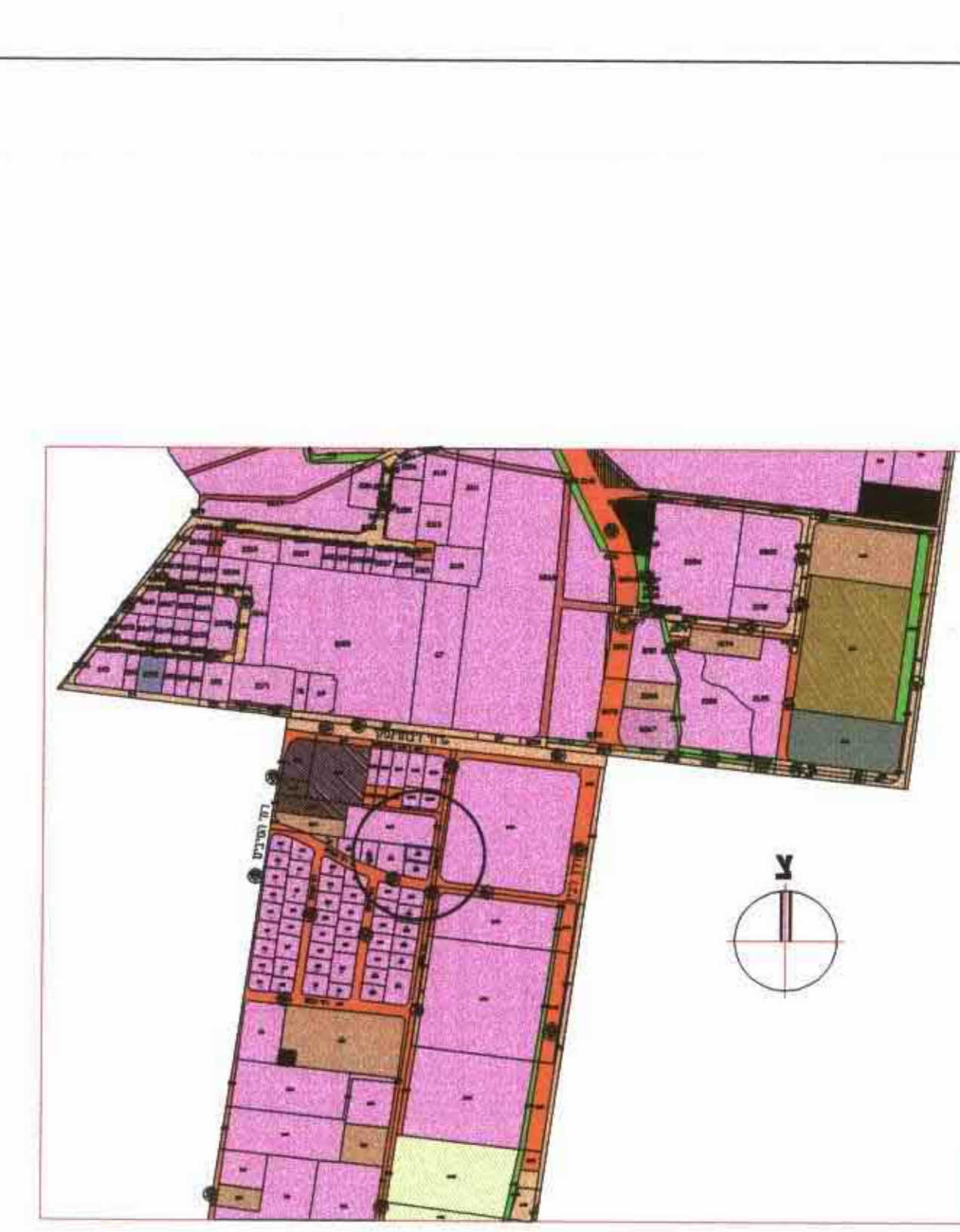
תרשים מיקום עירוני קני"מ 1:10000