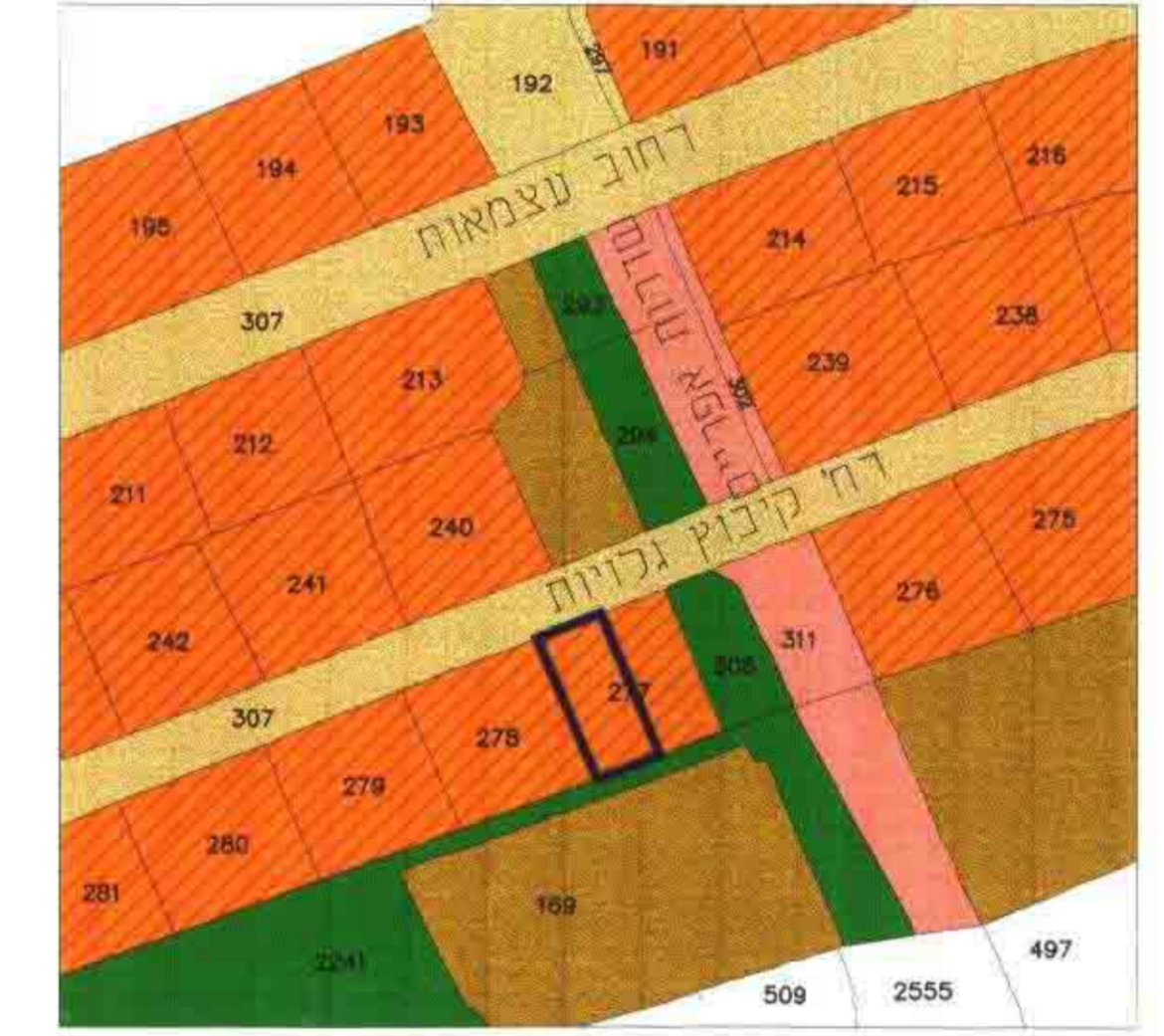
תרחיש המקום ק"מ 1:1250

גאודז-ניחול וסוד מקרקעין ובסיס גימ אימות אישור אשרה לתוקף ע"י ועדה סמ' חתימה 19/11/03