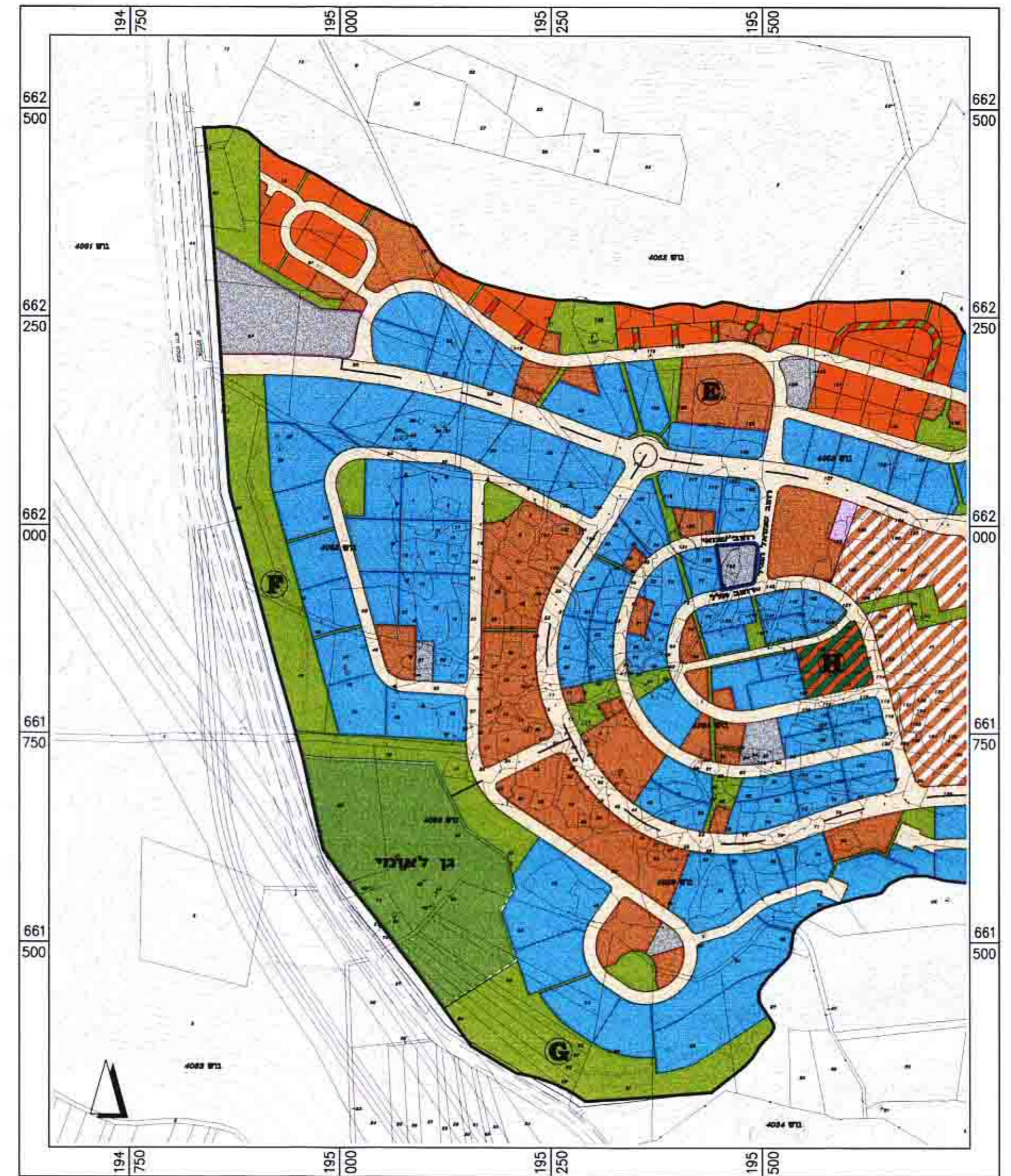
תרשים סביבה 1:5000