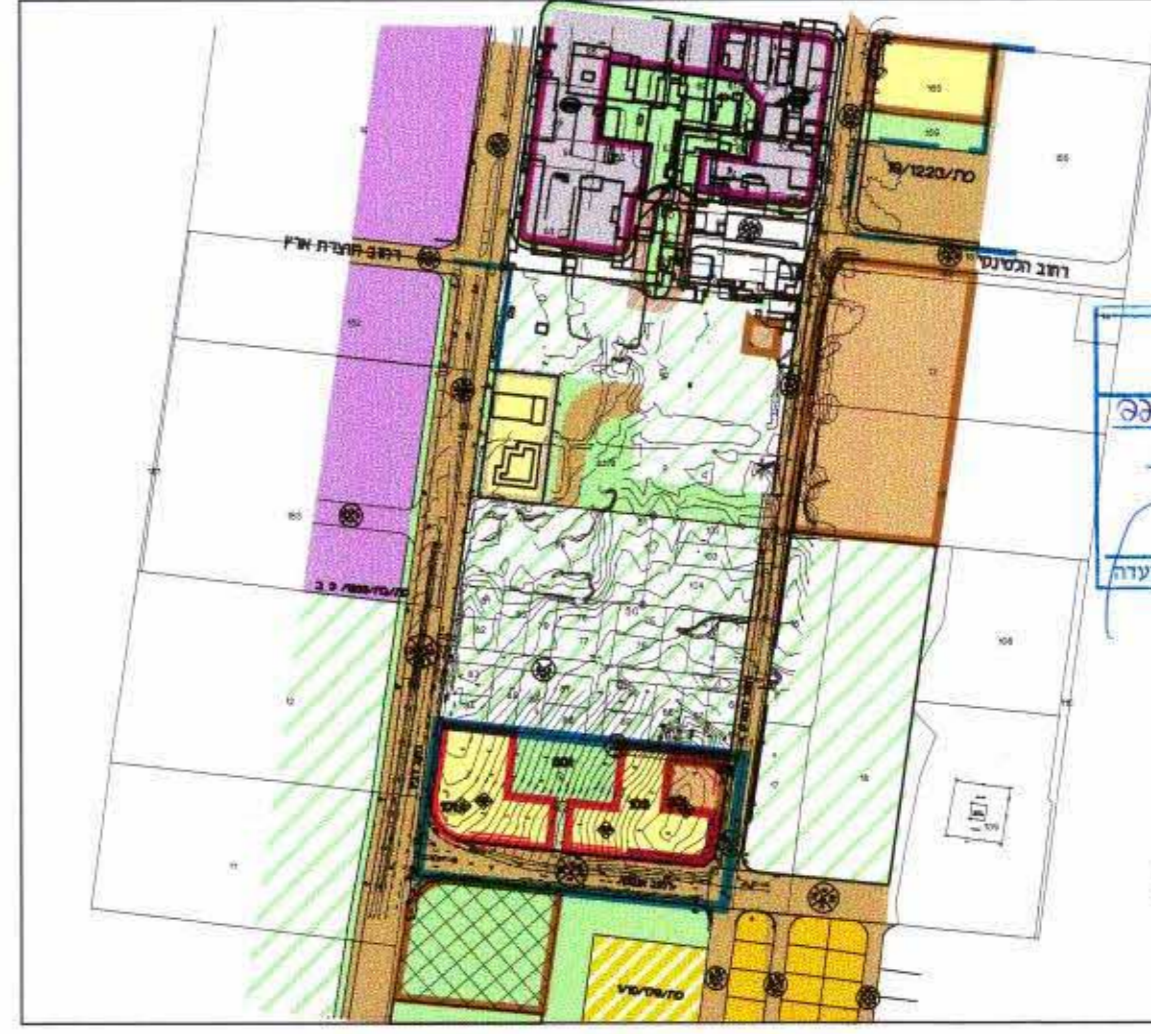
תרשים סביבה קנה מידה 1:5000

משרד הפנים מינהל מחוזי מרפ"ה-תל 27-03-2003 נתקבל ת"מ מס' 101