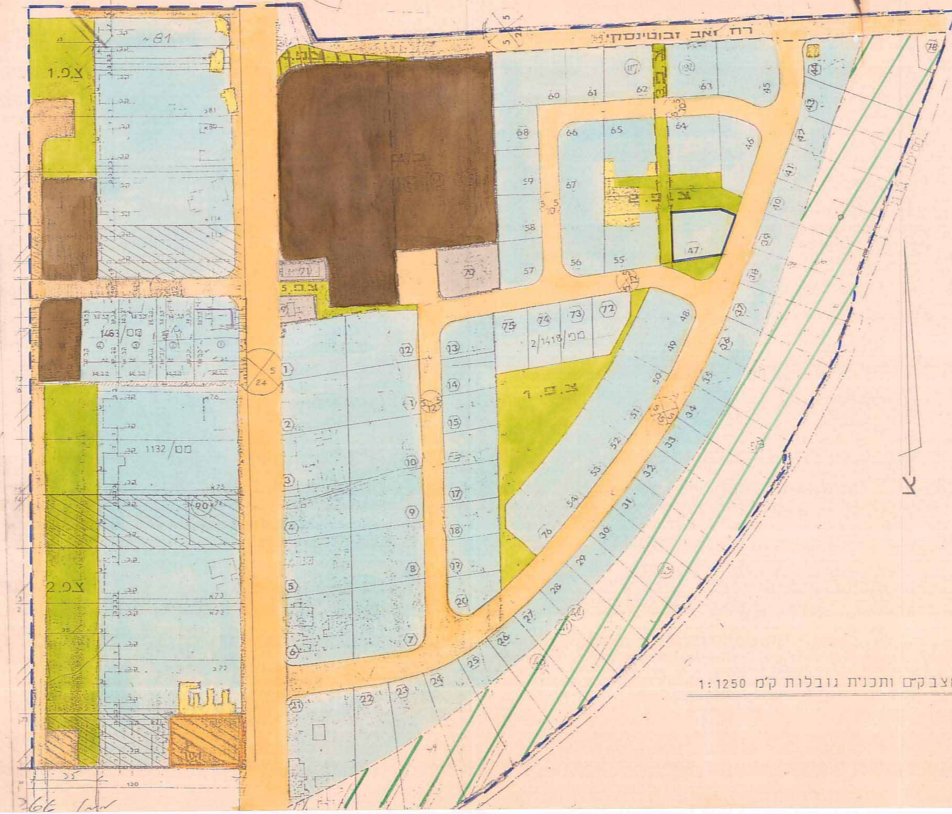
מצבקים ותכנית גובלות קמ 1:1250