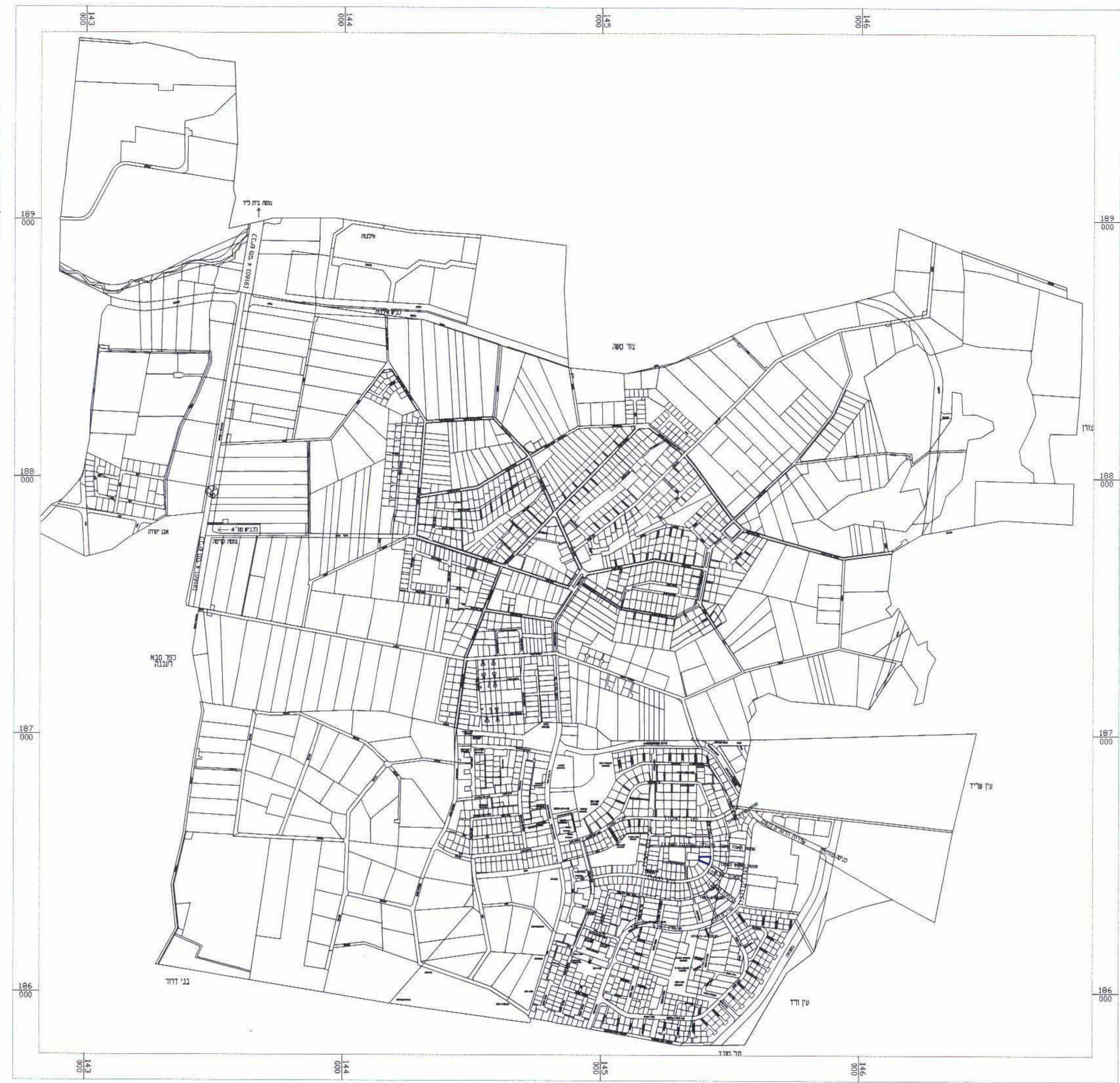
תרשים סביבה קנה מידה 1 : 10.000 עפ"י תכנית הצ/4-1/209 - קדימה

מרחב תכנון מקומי "שרונים" מחוז המרכז נפת השרון