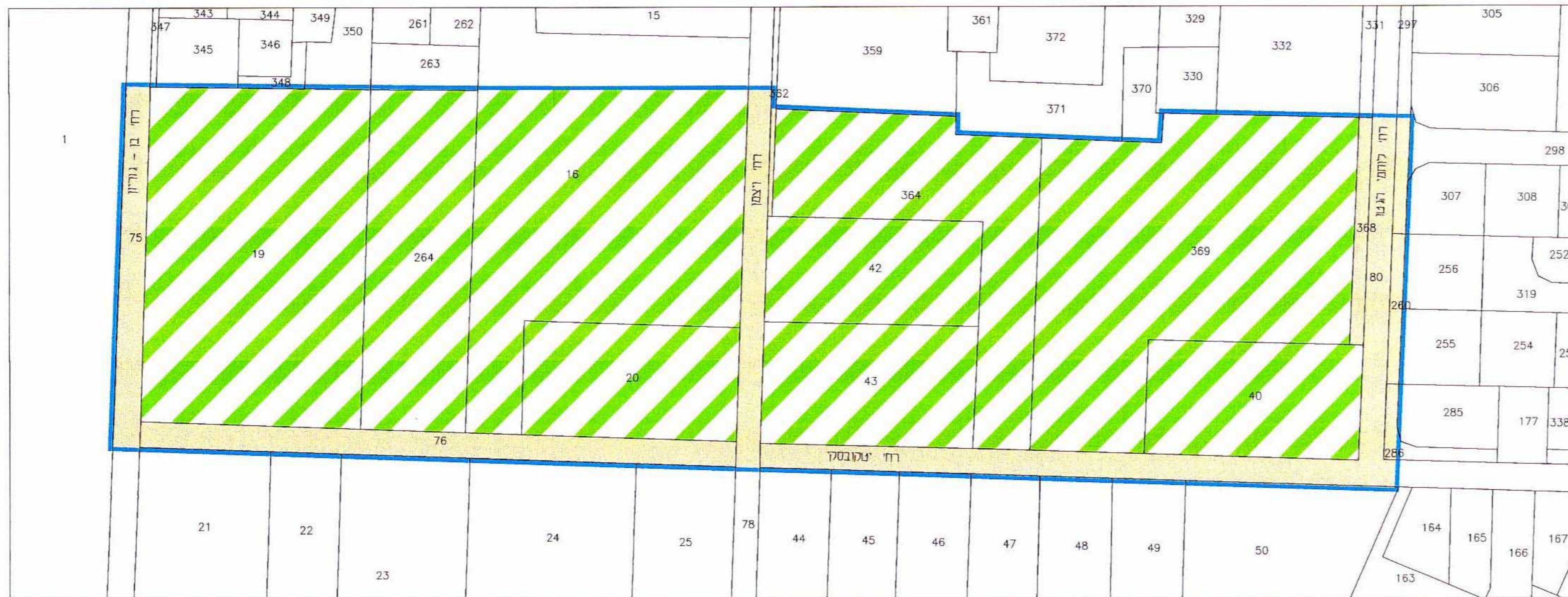
מצב קיים ק.מ. 1 / 1250