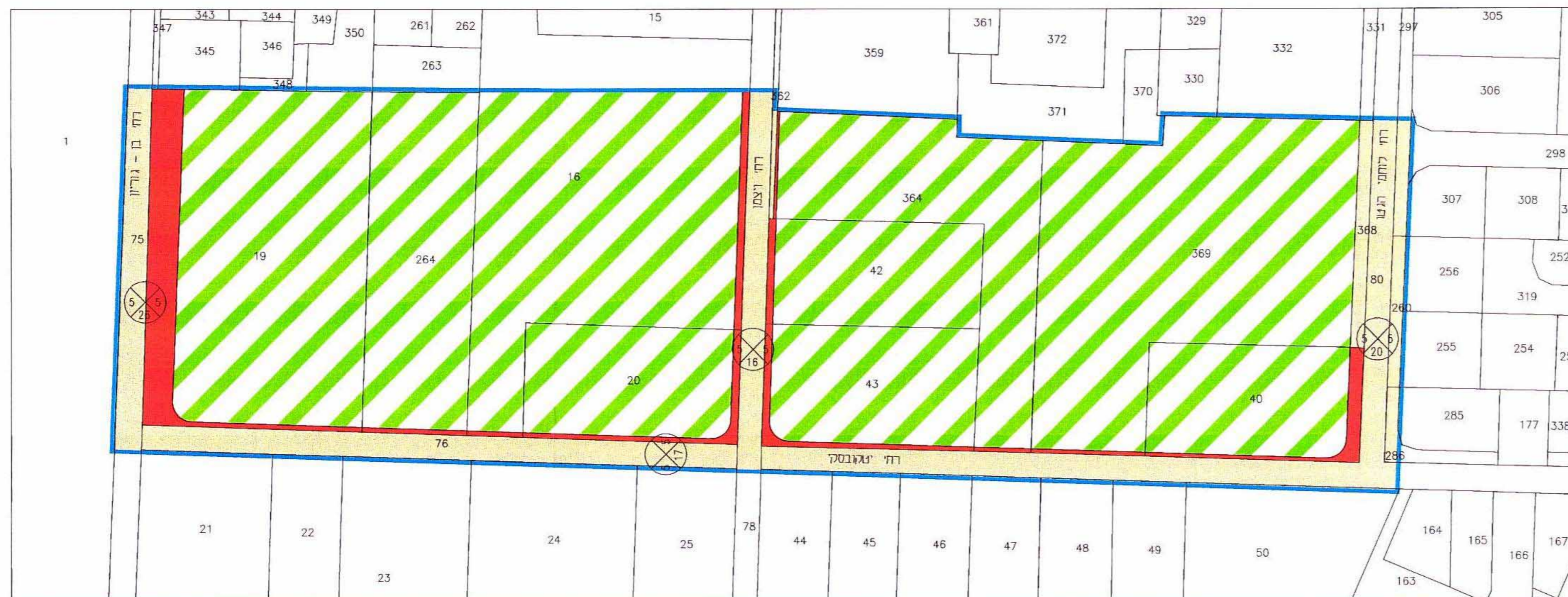
מצב מוצע ק.מ. 1 / 1250