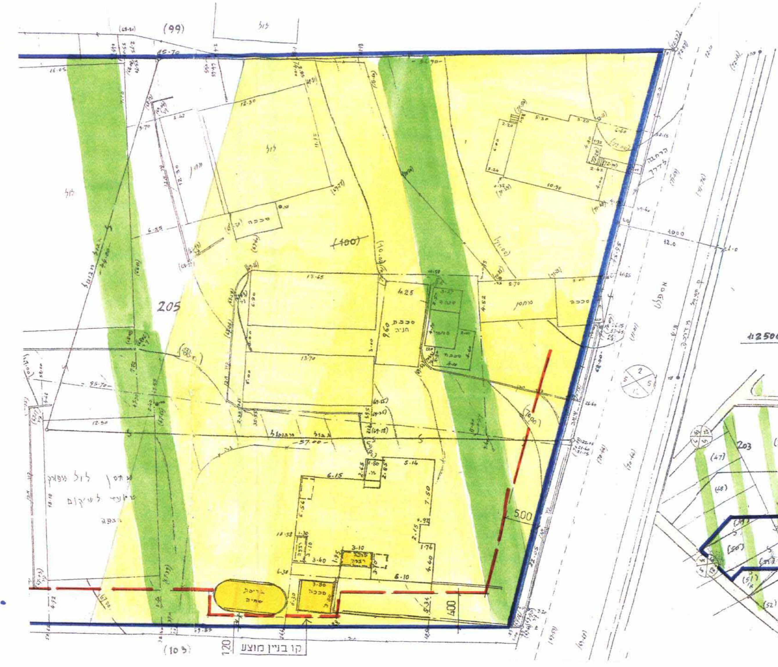
מצב מוצע 1:250