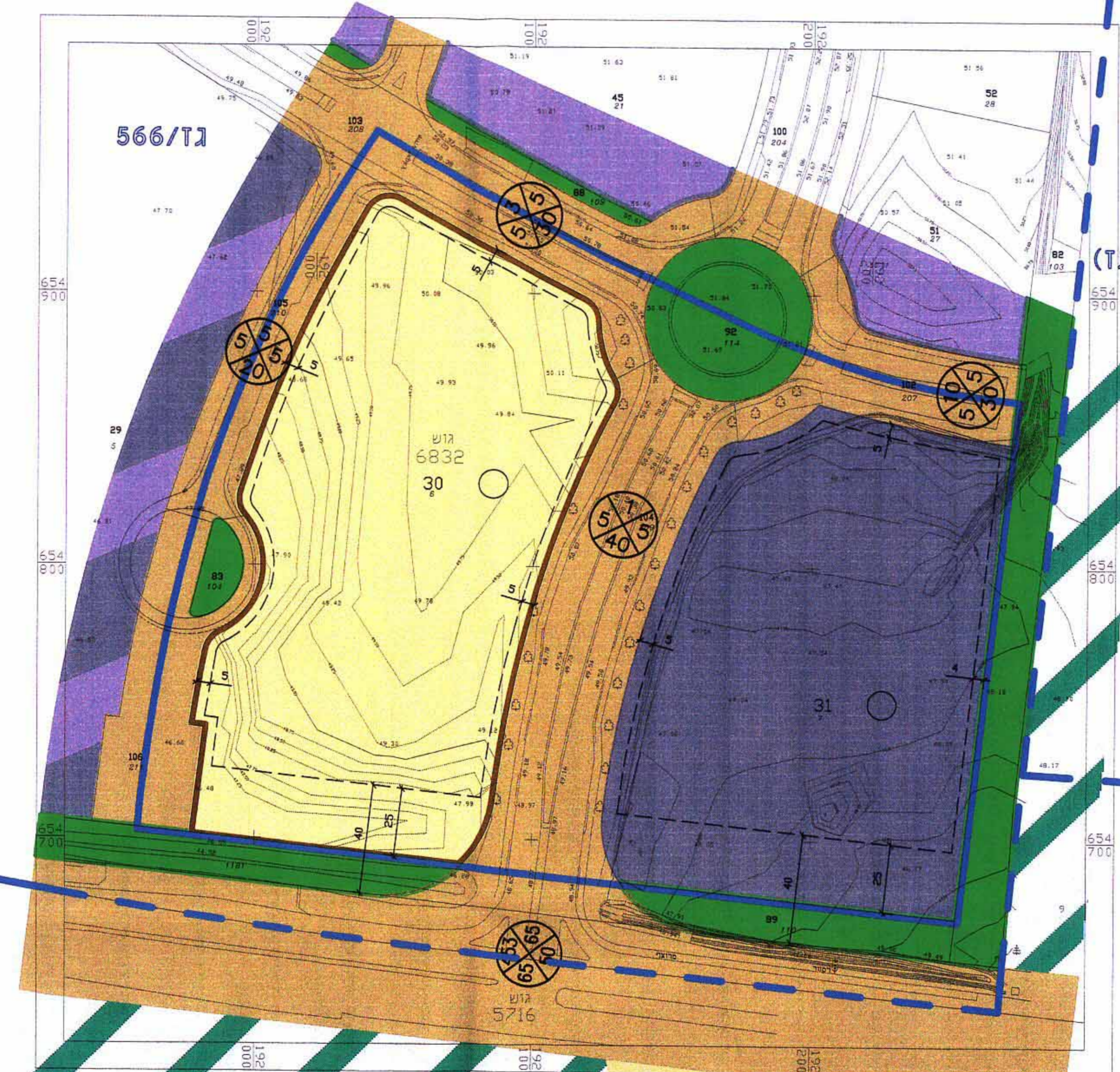
מצב מוצע קנ"מ 1:1250

משמ 57/57 (גז) משמ 30 (גז) מצב קיים קנ"מ 1:1250