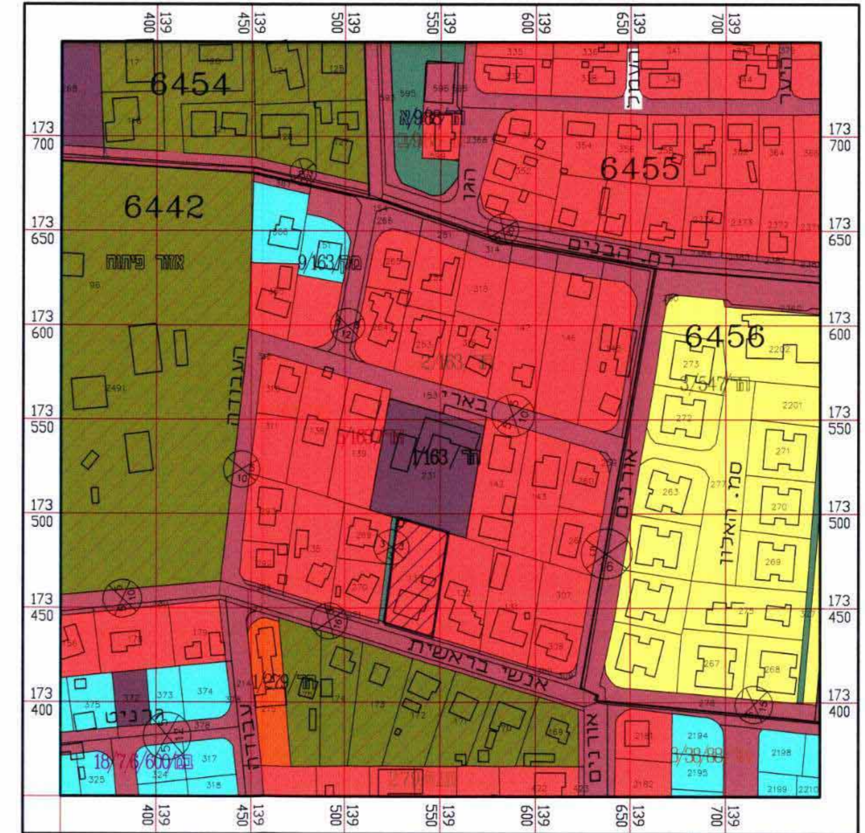
תעריפים הסוביבטה ק.מ. 1:2000