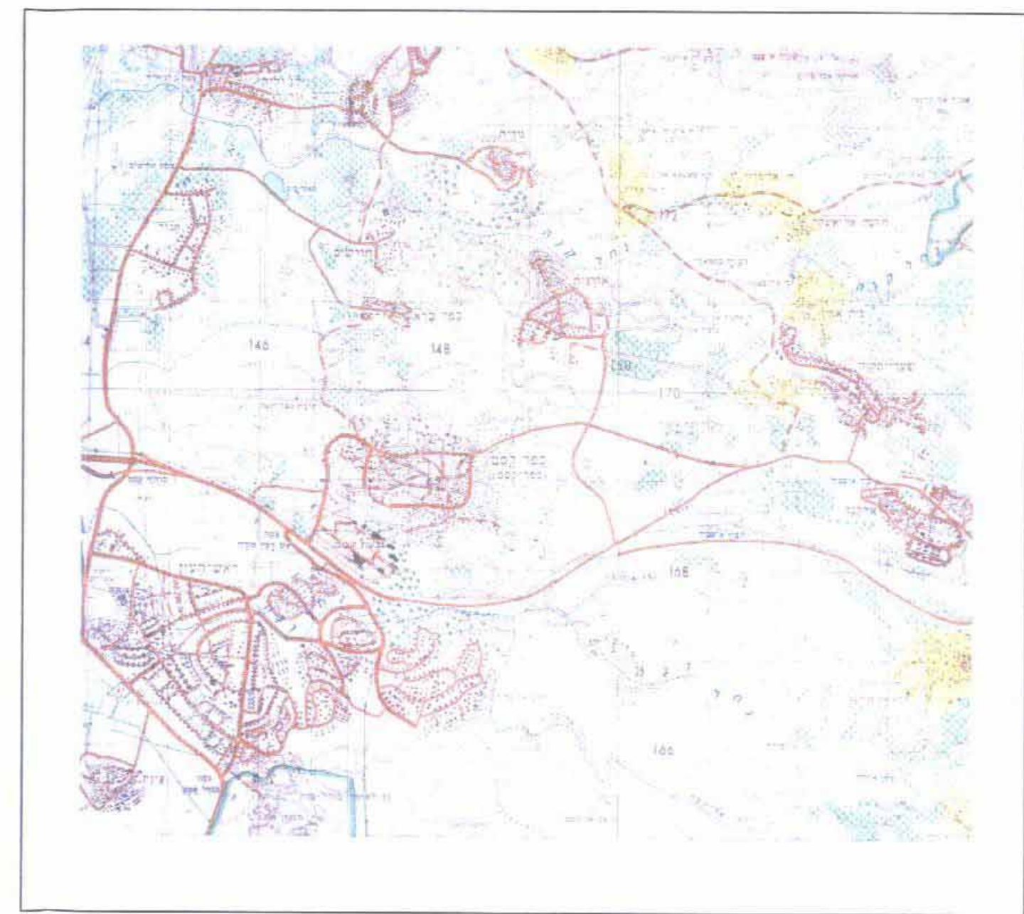
תרשים סביבה קני"מ 1:1250