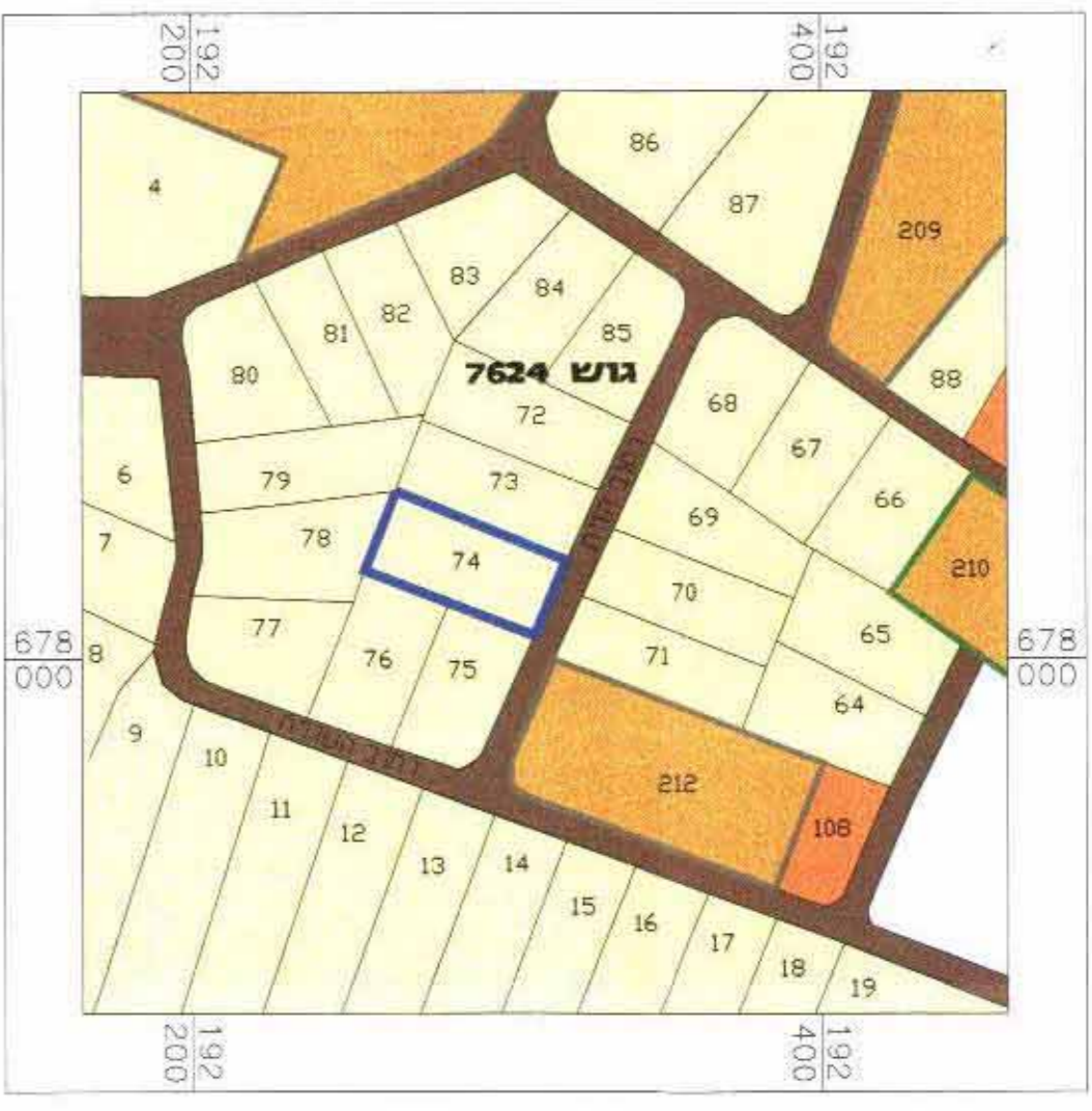
תרשים סביבה קני"ח 1:2500