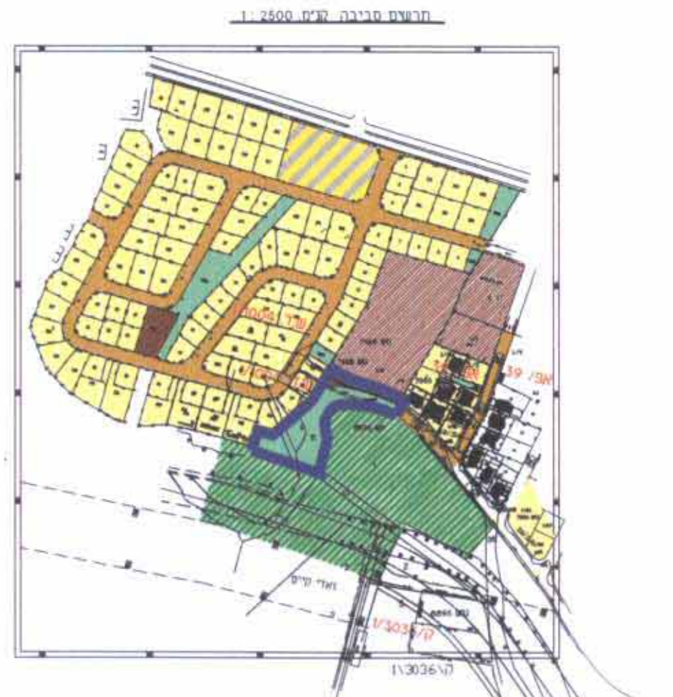
ב"ב קב"ב - סכ"מ דרישה: תכנון מפורט של תחום המיועד לביצוע

ג'וסי עבד אלמונעס משרד מתכנן תכנון תל. 03-9396001 פ. 050-443737 ג'ולג'וליה