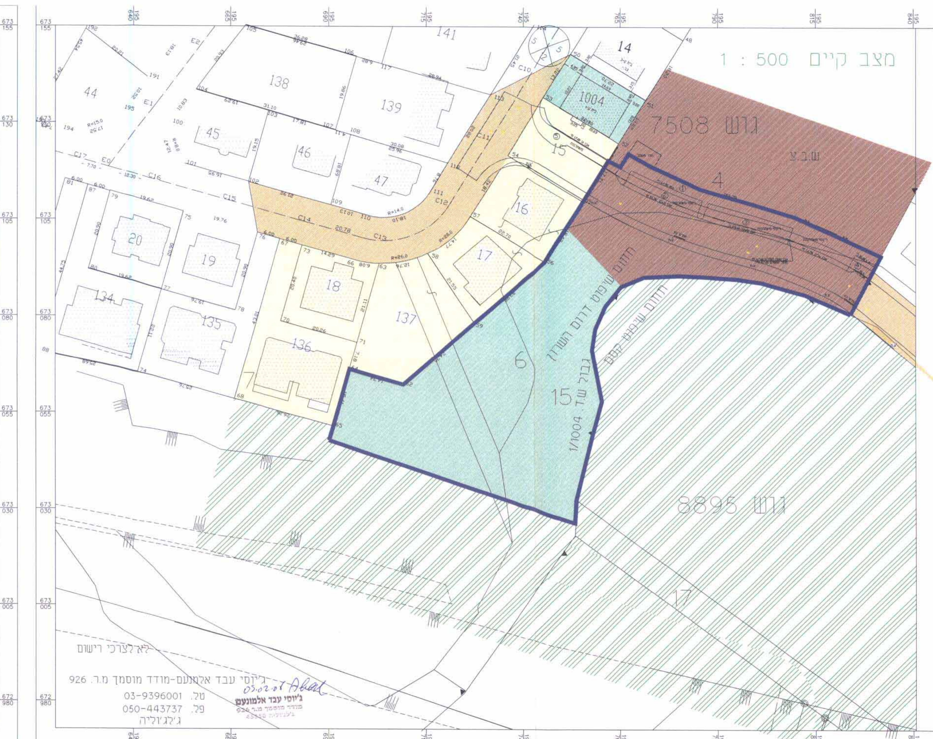
מצב קיים 1 : 500

ג'וסי עבד אלמונעס משרד מתכנן תכנון תל. 03-9396001 פ. 050-443737 ג'ולג'וליה