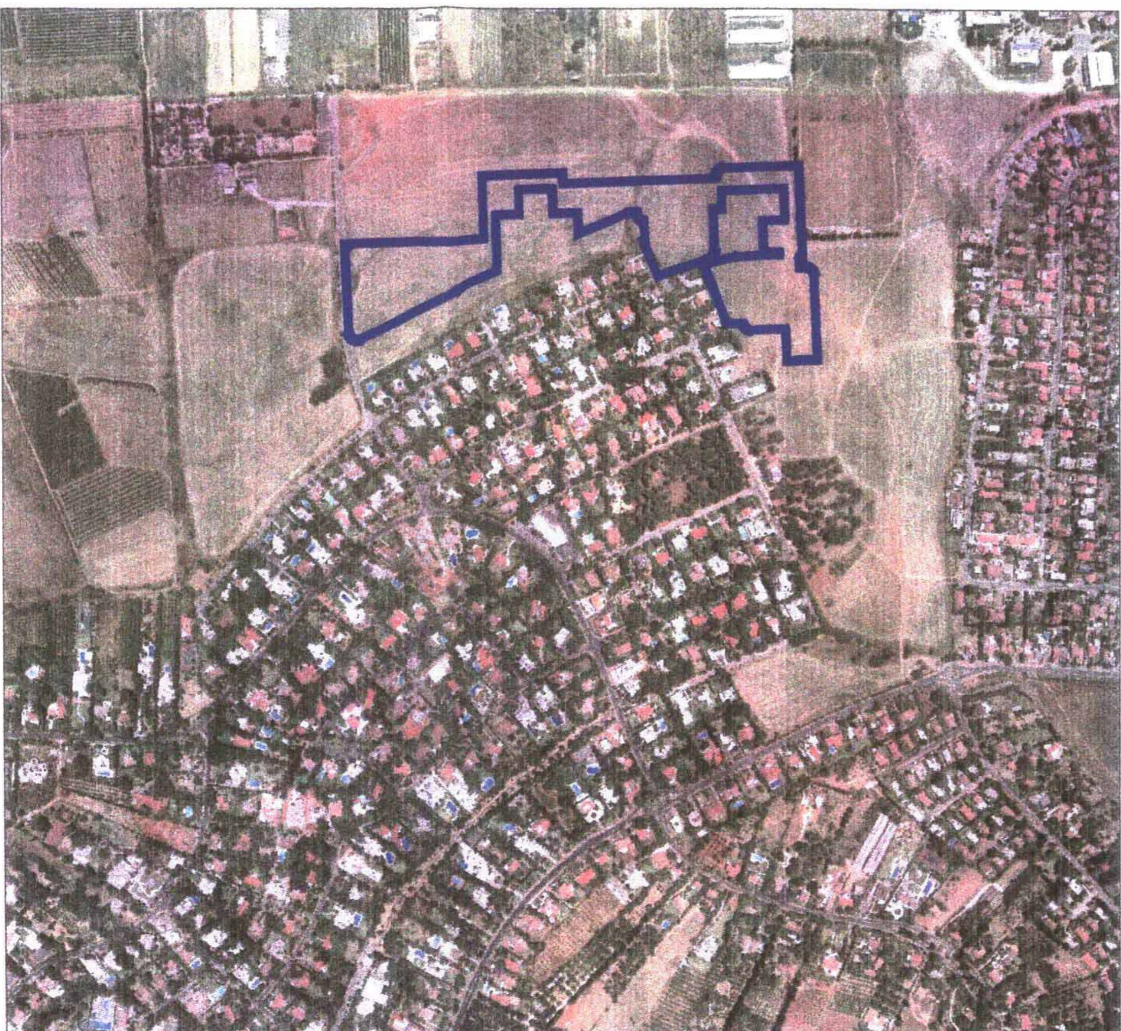
תרשים התמצאות ק.מ. 1:5000

srv5 d:\p\savlon\ronen shcehner\Fogel\15-5-05\tasrit-gadol-b\ta5206-b.dwg