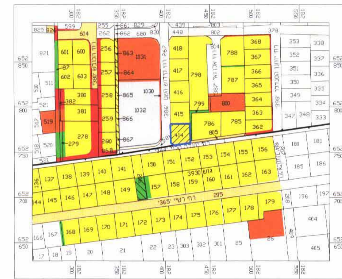
תרשים סביבה קי"מ 1:2500