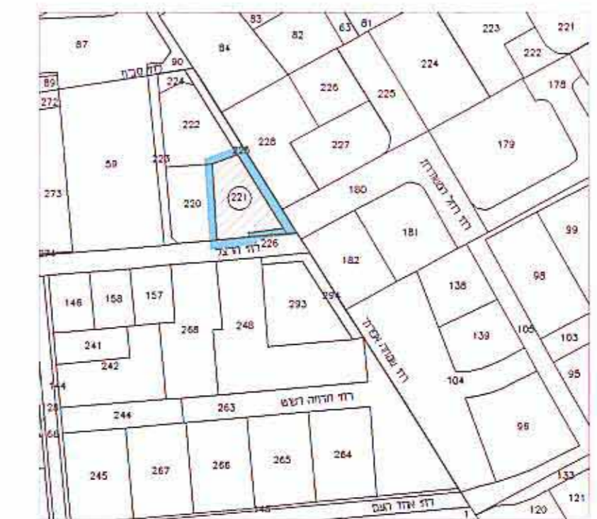
תרשים הסביבה ק.מ. 1 / 2500