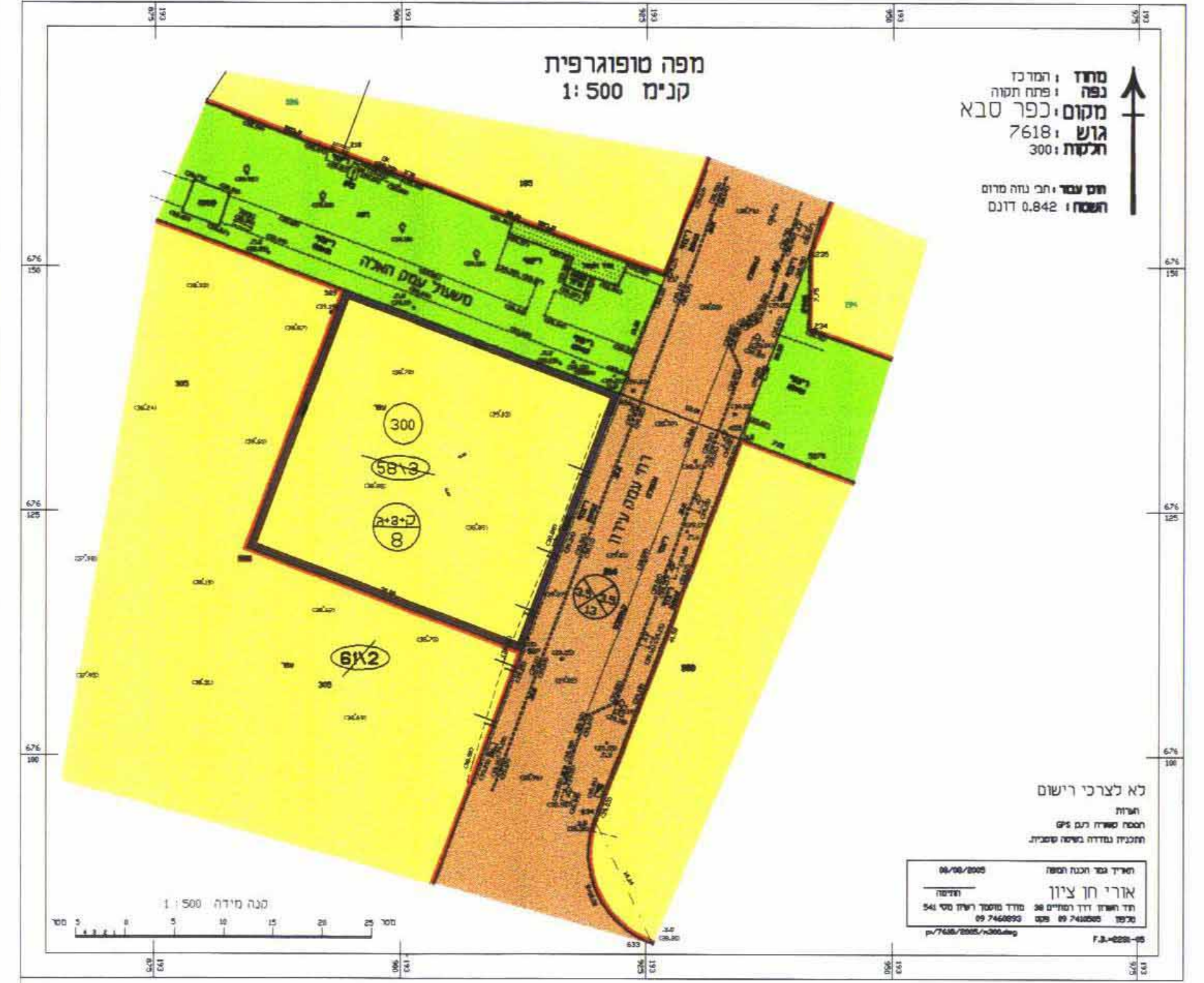
מצב הוצע קו"מ 1 : 500