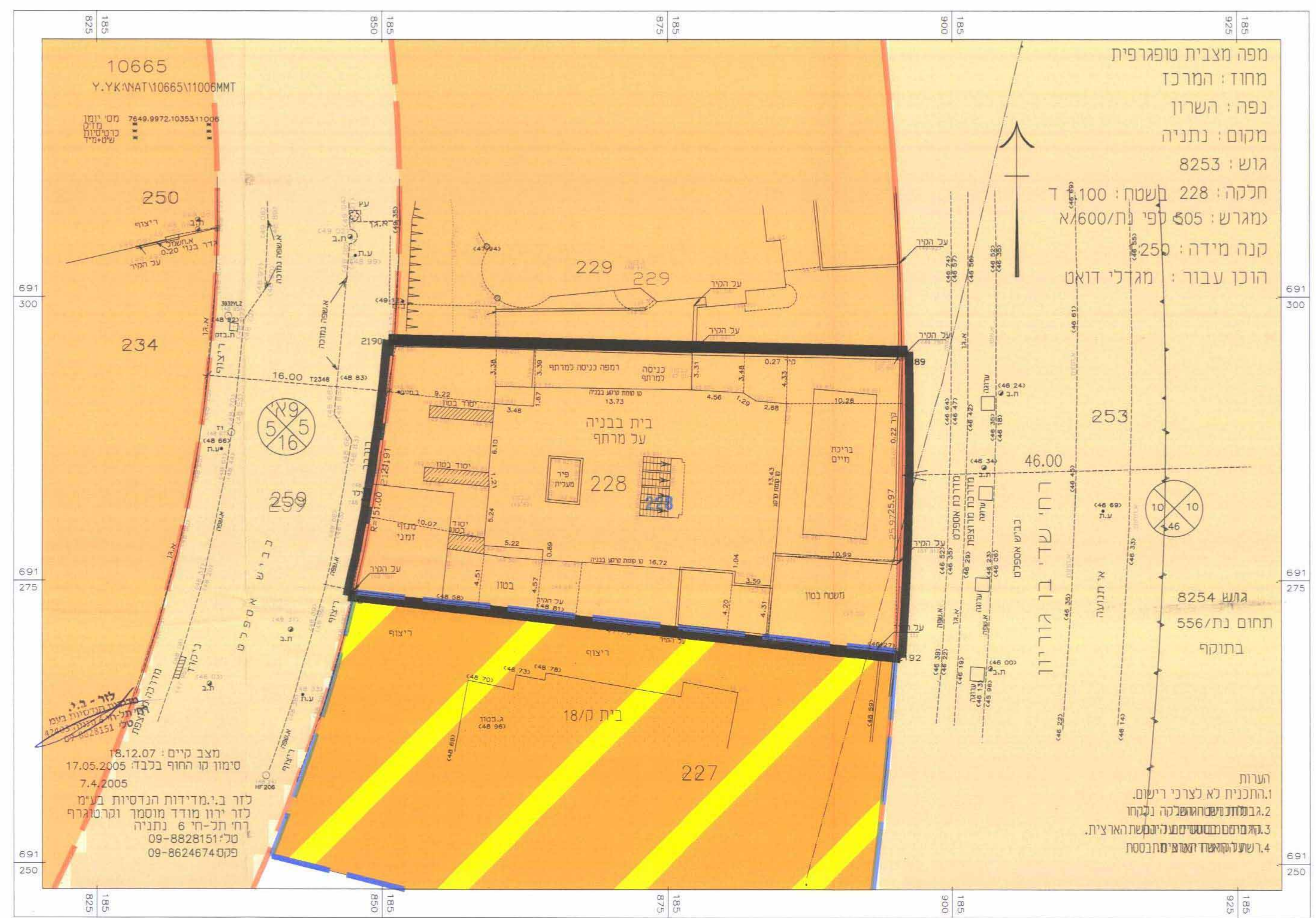
מצב מאושר קב"מ 1:250