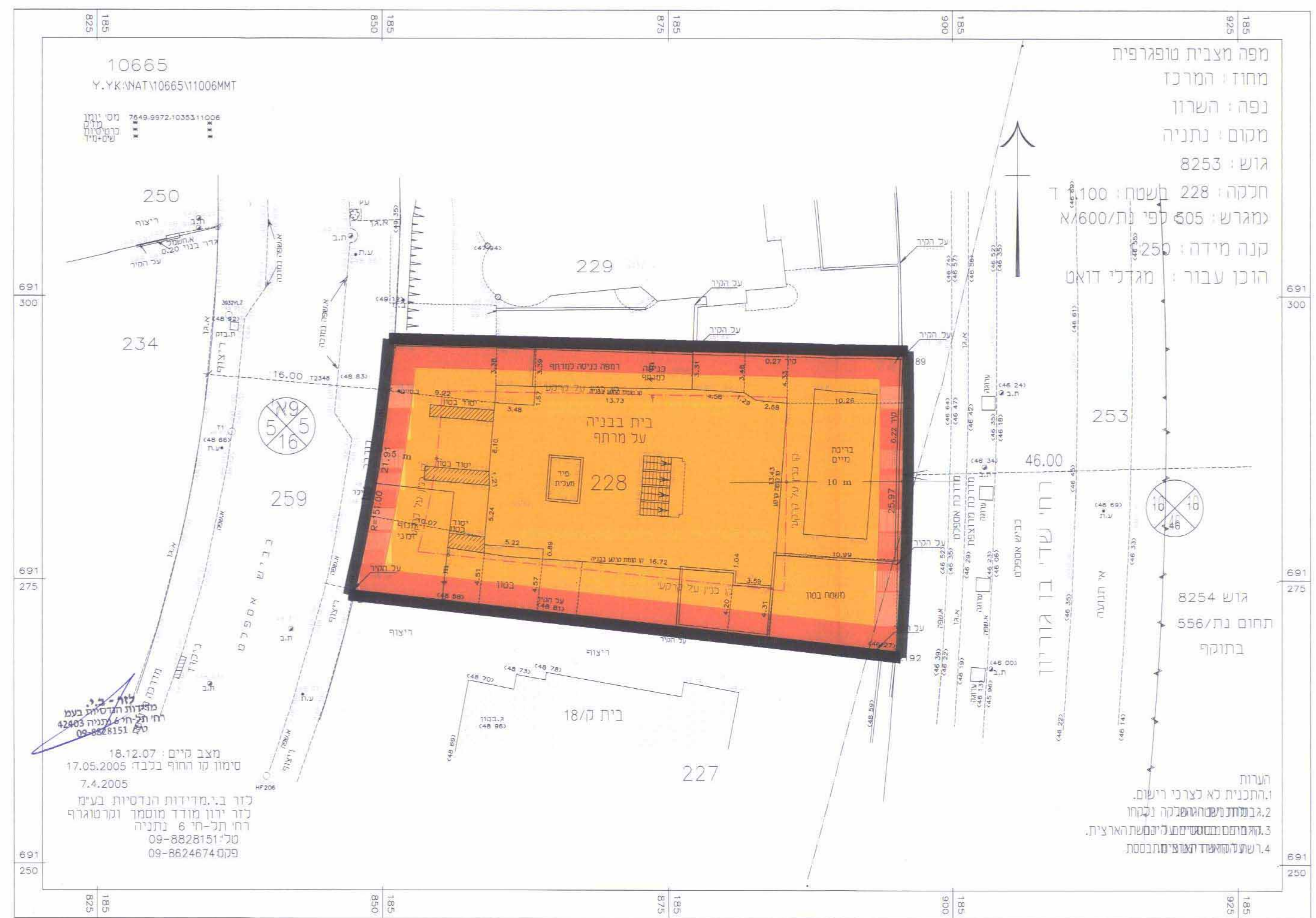
מצב מוצע קב"מ 1:250