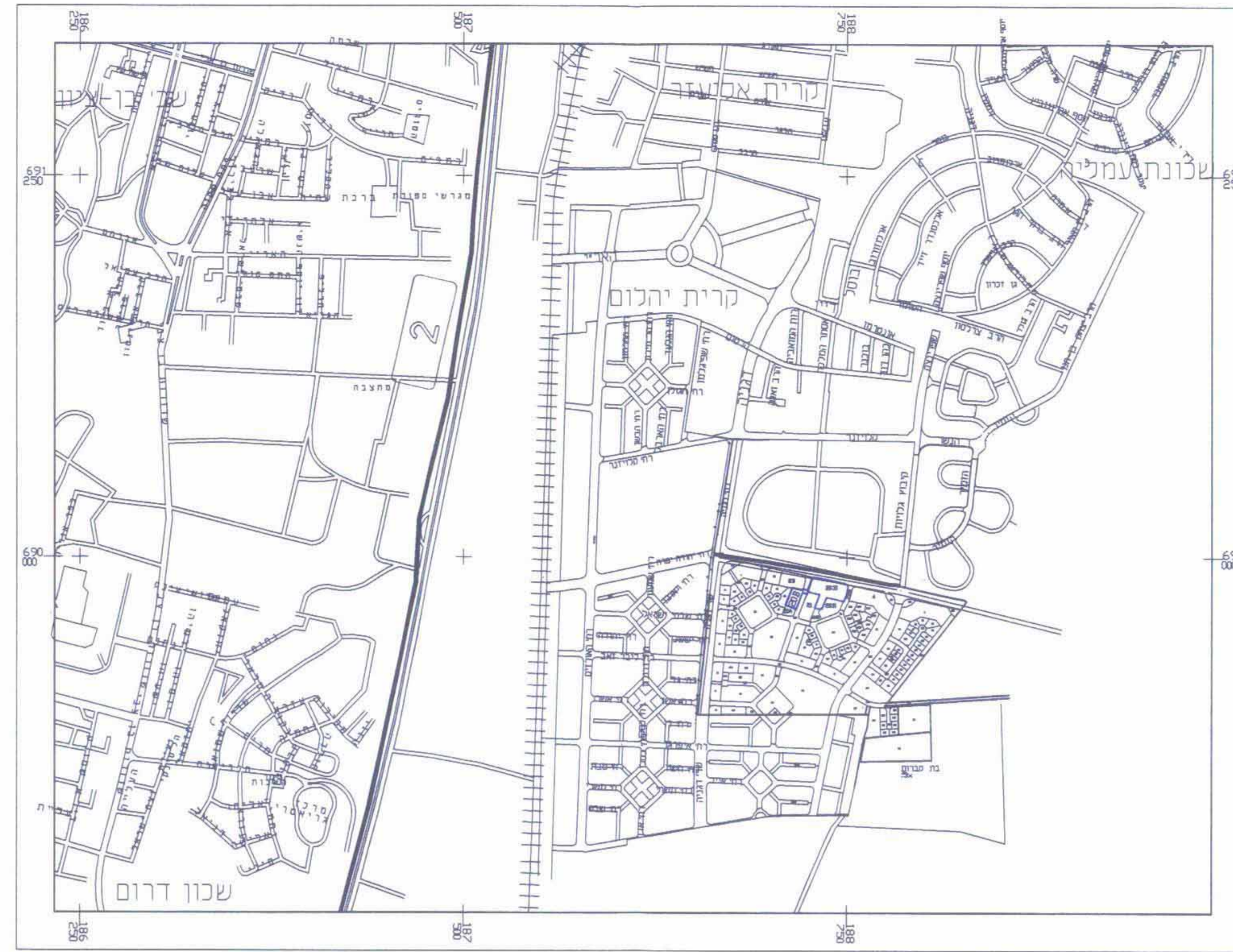
תרשימים התמצאות ק.מ. 1:12500