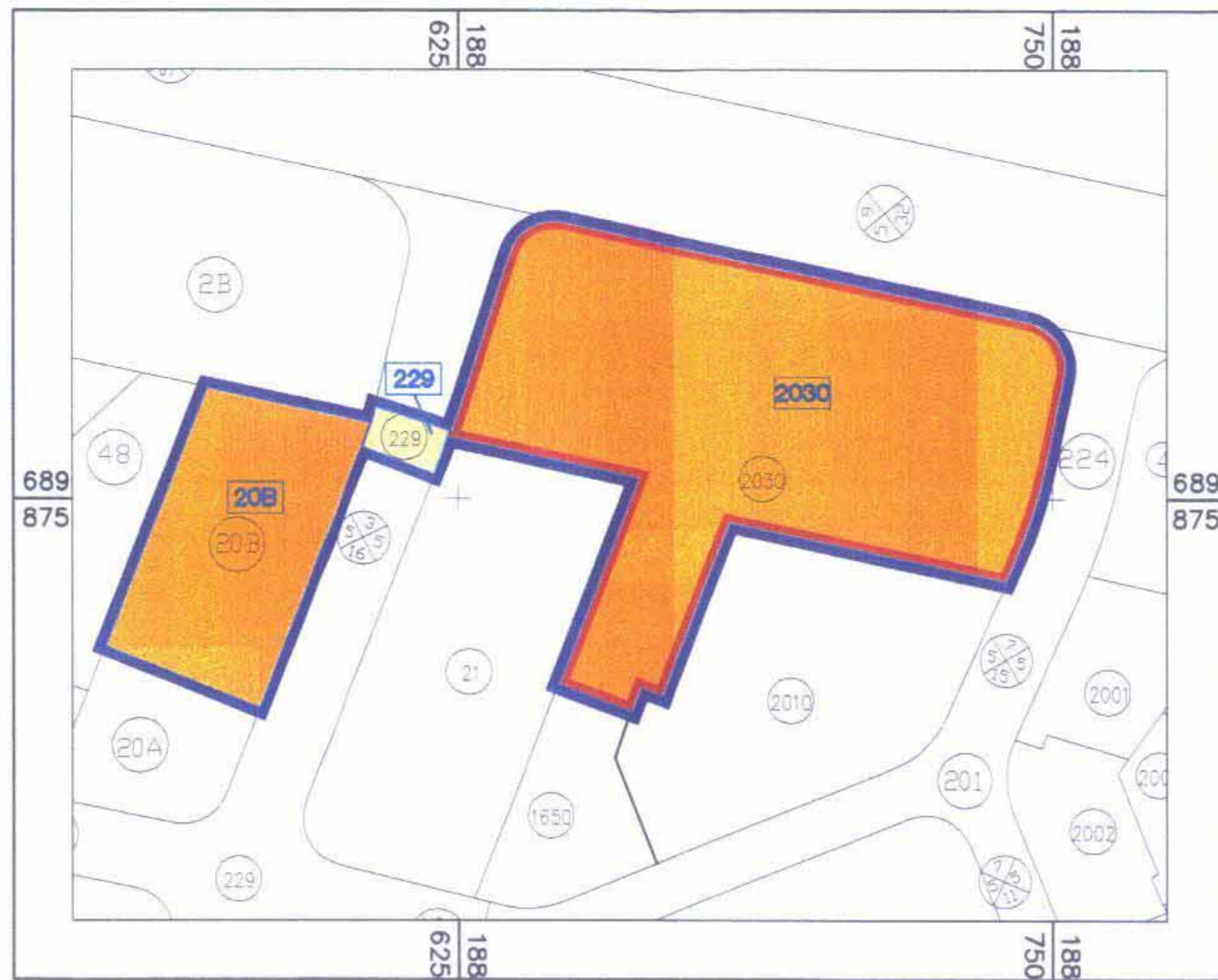
תשריט מצב מוצע קני"מ 1:1250