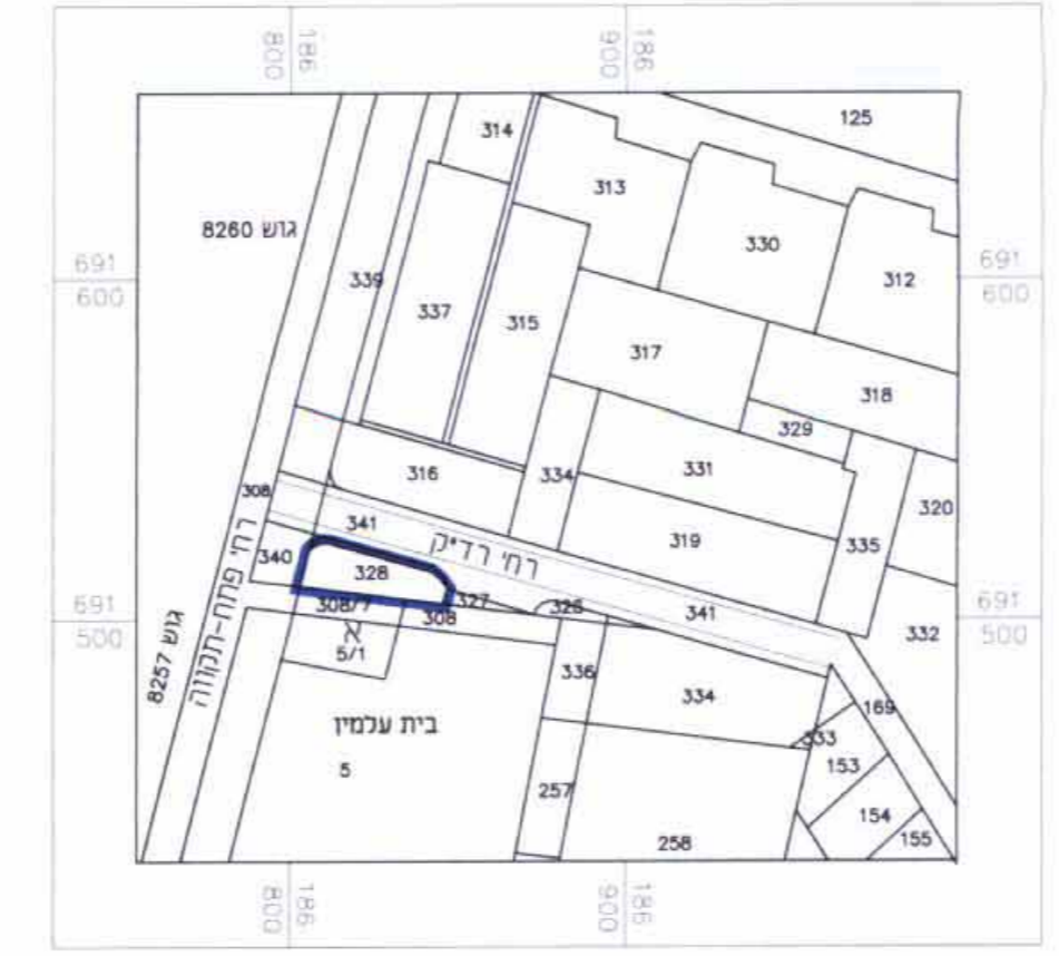
תרשים סביבה קנ"מ 1 : 2500