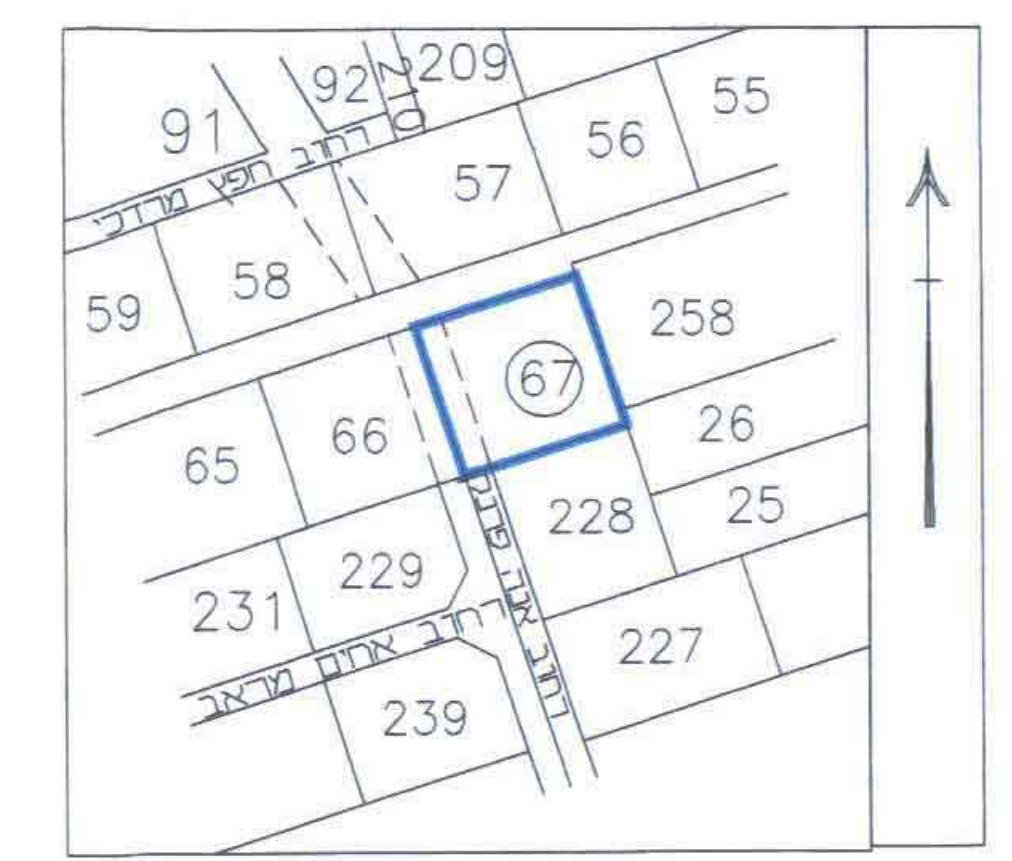
תרשים השכיבה ק.מ. 1/1260