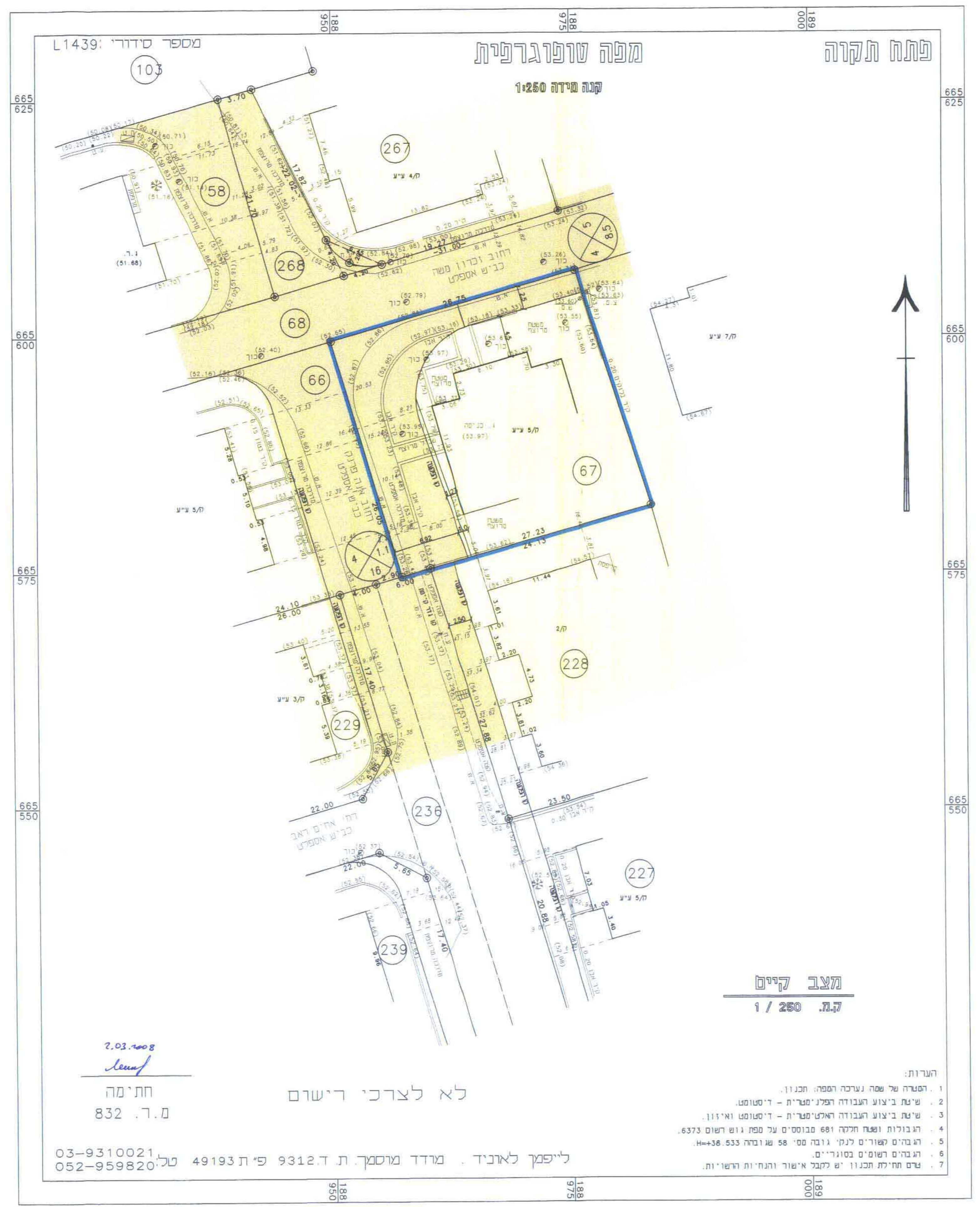
מצב קיים ק.מ. 1/260

הערות: 1. הפטור של שטח נערכה הפתח הבנוי. 2. שיעור ביצוע הגובה הפנימי - דיסטנט. 3. שיעור ביצוע הגובה האמיתי - דיסטנט וא"ו. 4. הגובה ושטח חלקה 68 מבוססים על מפת נוש' 6373. 5. הגובה שפורסם נתון גובה מס' 58 ש' 36-533. 6. הגבהים שפורסם בסוגריים - יש לקבל אישור ותחילת השינוי. 7. עדים חתום הבנוי יש לקבל אישור ותחילת השינוי. הערות: 1. הפטור של שטח נערכה הפתח הבנוי. 2. שיעור ביצוע הגובה הפנימי - דיסטנט. 3. שיעור ביצוע הגובה האמיתי - דיסטנט וא"ו. 4. הגובה ושטח חלקה 68 מבוססים על מפת נוש' 6373. 5. הגובה שפורסם נתון גובה מס' 58 ש' 36-533. 6. הגבהים שפורסם בסוגריים - יש לקבל אישור ותחילת השינוי. 7. עדים חתום הבנוי יש לקבל אישור ותחילת השינוי. ליפמן לאוניד, מרדד מוסמך ת.ד. 9312, פת 49193 טל. 03-9310021, 052-959820 חתימה מ.ד. 832