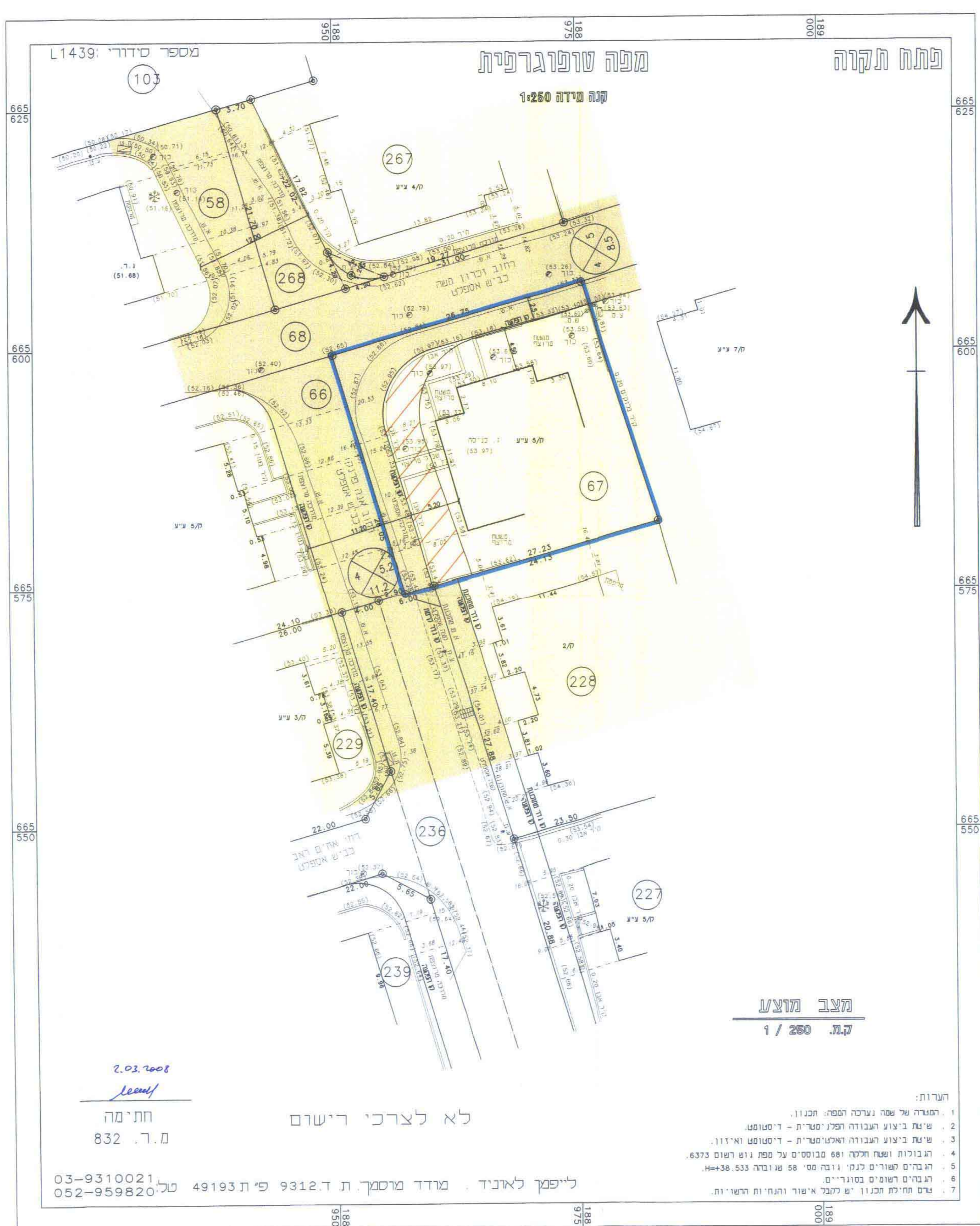
מצב מוצע ק.מ. 1/260

הערות: 1. הפטור של שטח נערכה הפתח הבנוי. 2. שיעור ביצוע הגובה הפנימי - דיסטנט. 3. שיעור ביצוע הגובה האמיתי - דיסטנט וא"ו. 4. הגובה ושטח חלקה 68 מבוססים על מפת נוש' 6373. 5. הגובה שפורסם נתון גובה מס' 58 ש' 36-533. 6. הגבהים שפורסם בסוגריים - יש לקבל אישור ותחילת השינוי. 7. עדים חתום הבנוי יש לקבל אישור ותחילת השינוי. הערות: 1. הפטור של שטח נערכה הפתח הבנוי. 2. שיעור ביצוע הגובה הפנימי - דיסטנט. 3. שיעור ביצוע הגובה האמיתי - דיסטנט וא"ו. 4. הגובה ושטח חלקה 68 מבוססים על מפת נוש' 6373. 5. הגובה שפורסם נתון גובה מס' 58 ש' 36-533. 6. הגבהים שפורסם בסוגריים - יש לקבל אישור ותחילת השינוי. 7. עדים חתום הבנוי יש לקבל אישור ותחילת השינוי. ליפמן לאוניד, מרדד מוסמך ת.ד. 9312, פת 49193 טל. 03-9310021, 052-959820 חתימה מ.ד. 832